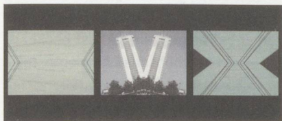
Simulierte Wirklichkeiten: Fragmente aus der Bildschicht von «ctrl + alt + delete».

Optical Noise (Design, Video), Sascha Armbruster (Saxophon) ZHDK Records 20/09