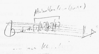
Abbildung 3: «Der Spaziergang» für zwei Baritone und Orchester (2007), Skizze zur «Meili-Episode», Takt 75 ff. © Michel Roth, Luzern

sondern eher als distanzierte Haltung, die erforderlich ist, um Dinge, die nicht ganz zusammen passen und sich ständig verändern, mit Vergnügen zu verbinden und spielen zu lassen. Man könnte auch sagen: Bei Roth resultiert das Spiel mit Nicht- oder Fast-Identitäten kaum aus einer grellen Verzweigung angesichts der aporetischen Natur der conditio humana oder der Selbst-Entfremdung des Menschen von heute – und wenn doch, ist zumindest nicht auszumachen, dass der Komponist ihr völlig hilflos ausgeliefert wäre.