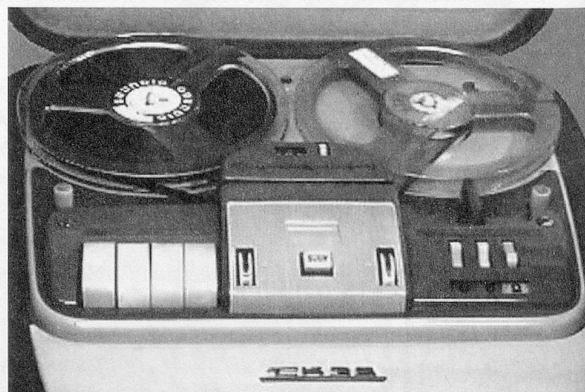
Abbildung 3: Tonbandgerät Grundig TK 35.

11. Vgl. Jean Dubuffet, Expériences musicales , in: Prospectus Bd.2, S. 182. Unter den Originalbändern Dubuffets fanden sich zwei mit Aufnahmen einer von Vian und Dubuffet drastisch manipulierten mechanischen Kirchesorgel. Eine besondere Vorliebe bildete dabei die Verfremdung von Militärmärschen, neben denen sich etwa Kagels Zehn Märsche um den