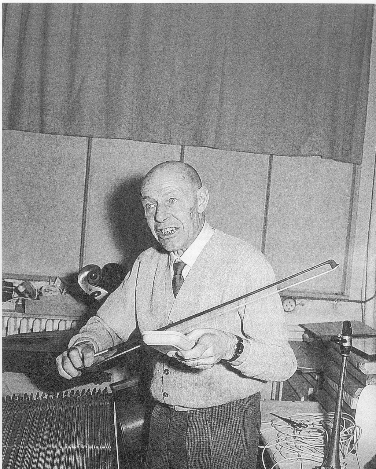
Jean Dubuffet, Paris 1961

1. Teil: Jean Dubuffets «Musique phénoménale» und «Expériences musicales»