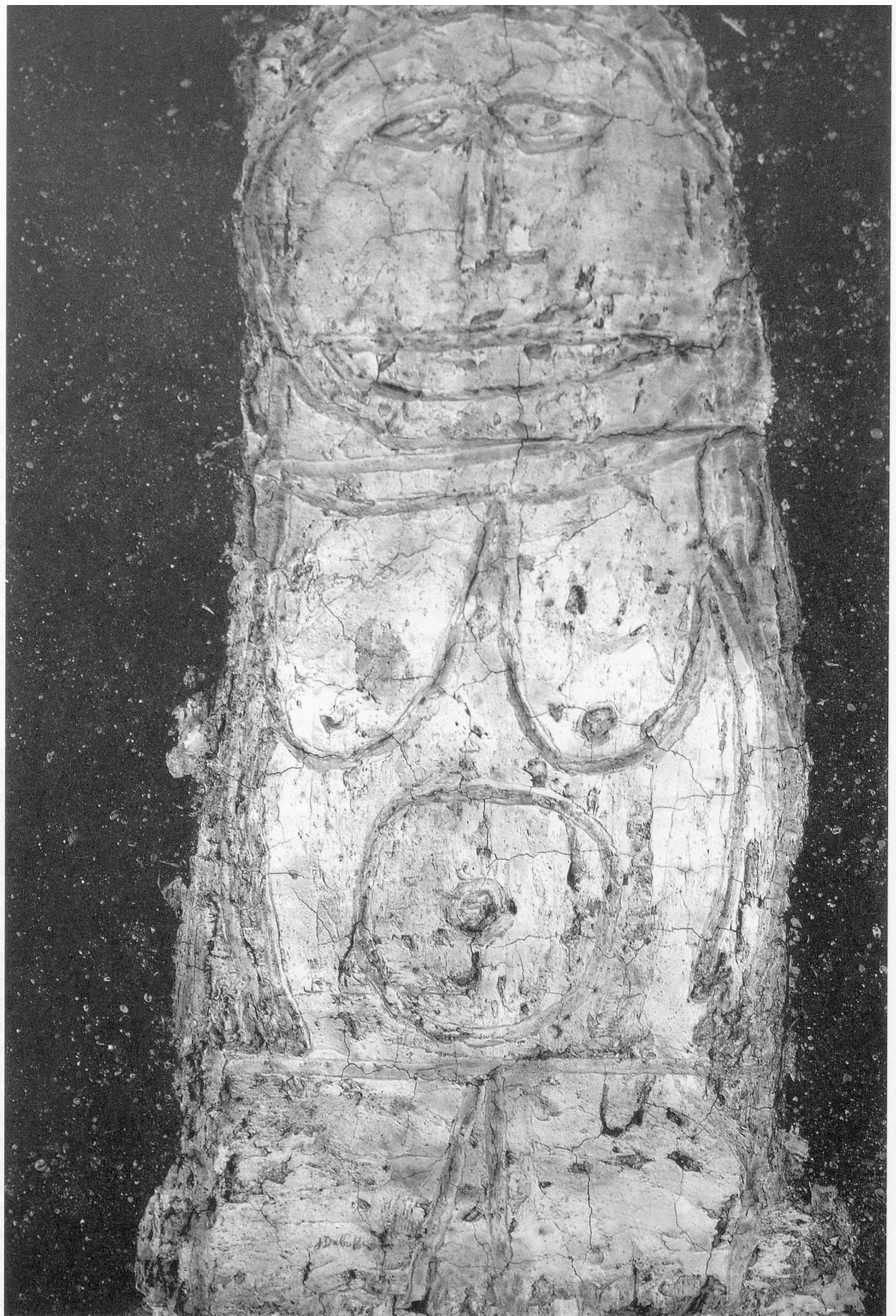
Abbildung 4: Jean Dubuffet; «Vénus du trottoir» (1946) Öl auf Stuckplatte, 102x82 cm, «Catalogue des travaux de Jean Dubuffet», élaboré par Max Loreau, Fascicule II, Lausanne 1964, No. 144, Musée Cantini, Marseille (ehemals in Besitz von Georges Limbour).