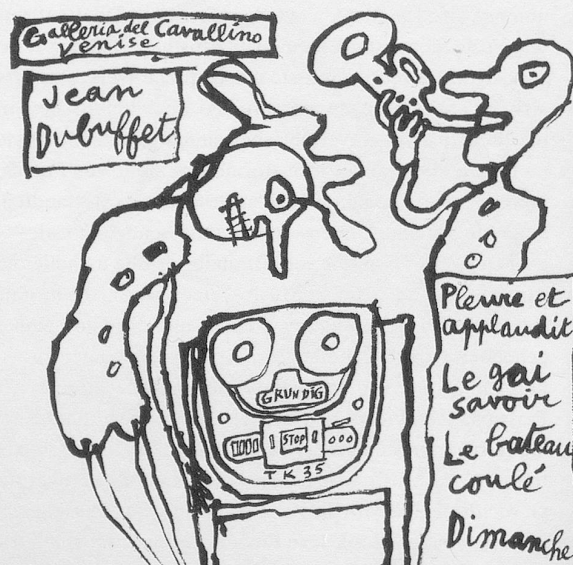
Abbildung 1: Jean Dubuffet, Plattencover «Expériences musicales» (1961)

6. Das betrifft die Auswahl von Stücken Dubuffets, die 1973 auf Anregung des Komponisten İlhan Mimaroglu und unter