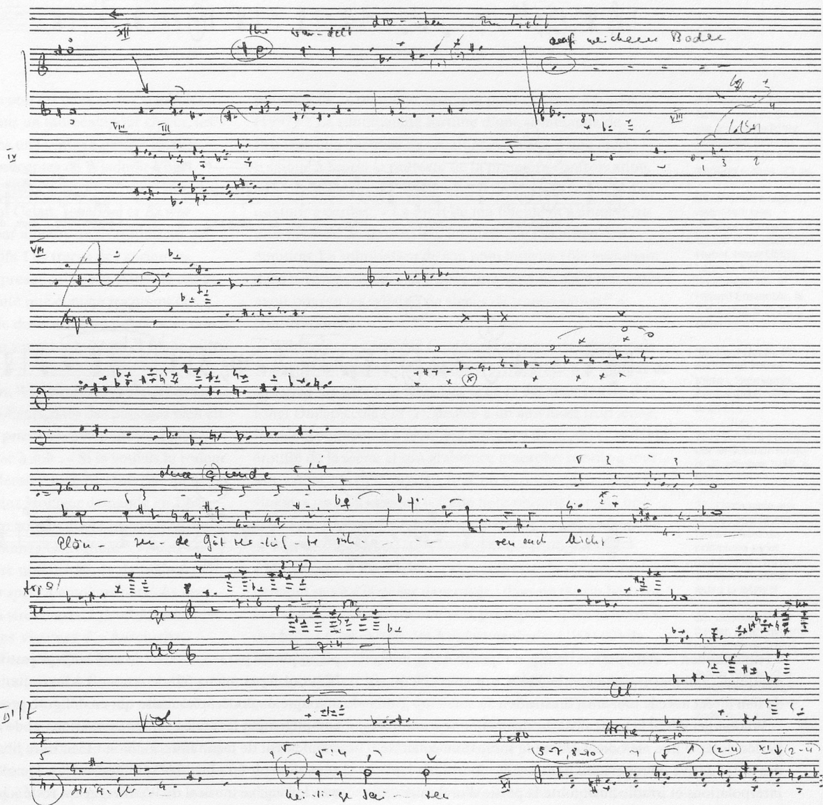
Illustration 4 : page 3 de l'esquisse de « An die Hoffnung »

Comme chez d'autres compositeurs, tels Berg ou Boulez, qui interprètent leurs séries originelles moins comme des prescriptions impératives que des possibilités, la technique d'interpolation de Wildberger n'est pas facile à déceler par l'analyse des œuvres. D'une esquisse, on pourra cependant constater que la transposition de la série à fa dièse (« VII »), dans la partie chantée, regroupe les deux premières strophes