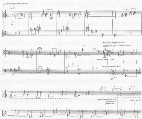
Franz Furrer-Münch: «Souvenirs mis en scène»

Eigenartige Hörerfahrungen erlebt, wer sich eine CD lang auf die Musik Franz Furrer-Münchs einlässt. Dass da eine ausserordentlich eigenständige Stimme redet, ist nach wenigen Tönen schon unverkennbar, dass hier eine Welt sich zeigt, die konzentriert geformt nach Ausdruck verlangt, ebenso. Aber: «Zeigt» sich diese Welt eigentlich wirklich? – Die spontane Hörerfahrung setzt sich zunächst als eine doppelte fort: Einerseits wird man augenblicklich eingenommen und mitgeführt. Das tastende Kreisen der Bassflöte, der Antrieb durch die Pauken, das Cello als klangliche Gegenstimme – eine Steigerung... und dann der Einsatz der Singstimme «Eines Abends, ...da ...ging und kam...»: Dies alles gleicht zunächst einem konventionellen Einstieg, der ein Werk emphatisch in Gang setzt und gleichzeitig dessen Thematik des «Gehens» assoziieren lässt – doch mit dem Einsatz des Textes erfolgt auch schon die Zurücknahme. Nur andeutungsweise sind die Worte am Anfang verständlich, die musikalische Gestik entwickelt sich zu Beginn scheinbar unabhängig von einer direkten Ausdeutung der Worte, um dann aber doch nach Bedarf und ohne