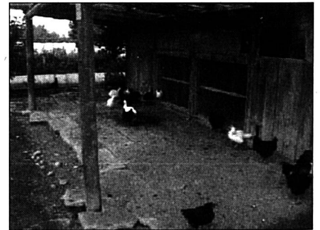
Le 8.9.98 à 08h53, des poules noires ont rejoint les poules blanches; les vaches sont introuvables; seul, un chat se promène dans l'aire d'alimentation...

Tentative avec des animaux plus volumineux et présentant une fiabilité plus grande dans la détermination de l'espèce et du bonheur: les vaches. Zoom sur l'étable: ce 7 septembre à 14h08, elle est vide. Les animaux sont évidemment en train de «brouter l'herbe grasse du pré». Direction le pâturage et zoom sur ce qui devrait être un groupe de bovidés: tout ce que je peux affirmer, c'est qu'il pleut au Brüderhof à 14h10... Manque de chance, des gouttes d'eau sur la caméra ont trompé le système de mise au point qui donne une image nette... des gouttes d'eau, alors que les vaches broutant apparaissent dans un flou ne