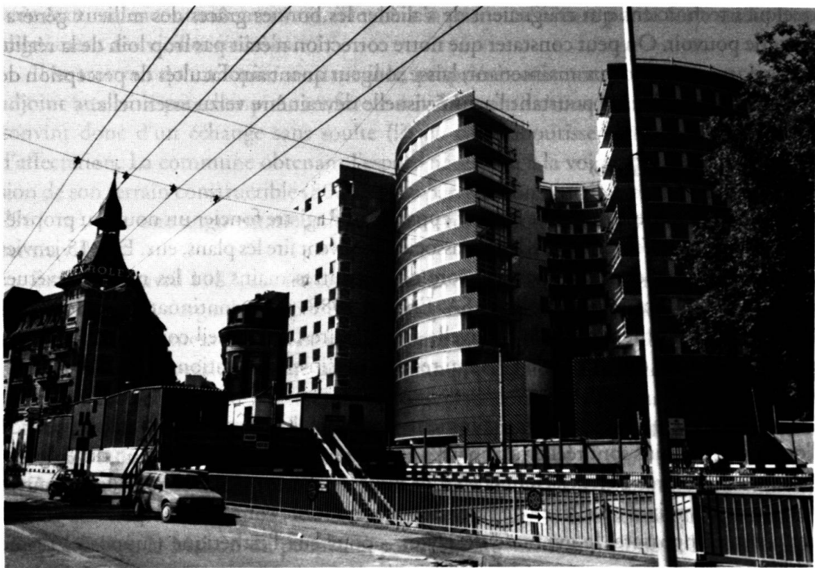
La situation actuelle