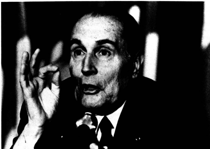
François Mitterrand, le meilleur représentant du Scorpion en politique.