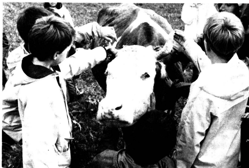
Les élèves sont invités à toucher (ici au Mont-sur-Lausanne)

entreprise un petit côté «reconstitution artificielle»: il n'y a plus guère qu'au musée du Ballenberg que le pain soit fait de cette façon et celui que nous mangeons passe par des étapes beaucoup plus mécanisées. Mais qu'importe, pourvu que la démarche soit honnête: les visiteurs peuvent être avertis et deviendront d'autant plus critiques face à des produits de facture industrielle, ou exigeants dans la recherche de produits de qualité. L'honnêteté est également nécessaire pour bien comprendre la relation entre l'homme et l'animal: les si jolis petits lapins qui courent dans l'herbe sont destinés à être tués, tout comme les vaches ou les poules. Pour éviter le côté «musée», il est important, selon Bruno Dumont, animateur de l'expérience lausannoise (voir encadré), que «les enfants vivent la ferme. Ils ne viennent pas regarder des vitrines, mais participer aux tâches: nettoyer l'écurie, s'occuper des bêtes, du jardin, etc. Ils y vivent des moments forts, parfois difficiles, lorsqu'ils se rendent compte qu'il faut tuer une poule ou que les lapins