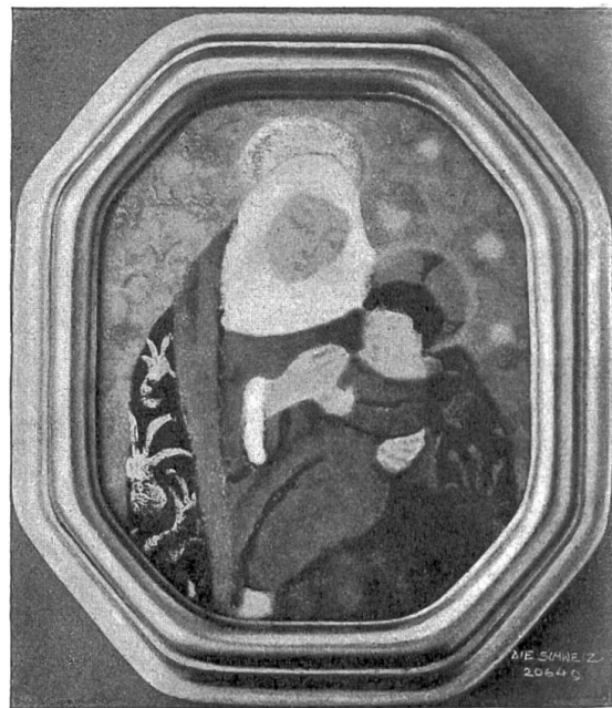
A. Sandoz, Genf.

im Zusammenklang mit den übrigen Akzenten der platonisch-erotischen Dämonie. Man wünschte wohl an mehreren Stellen die Hiltbrunnersche Verlautbarung, nach der sinnlichen wie nach der übersinnlichen Seite hin, voller vom Erlebnis geschwellt. Zudem ist die, offenbar angestrebte äußerste Komprimierung des Seelenstoffes, trotz der in richtiger Erwägung durchgehaltenen Kürze der Gedichte, keineswegs immer gelungen. Gotisches Sehnen: