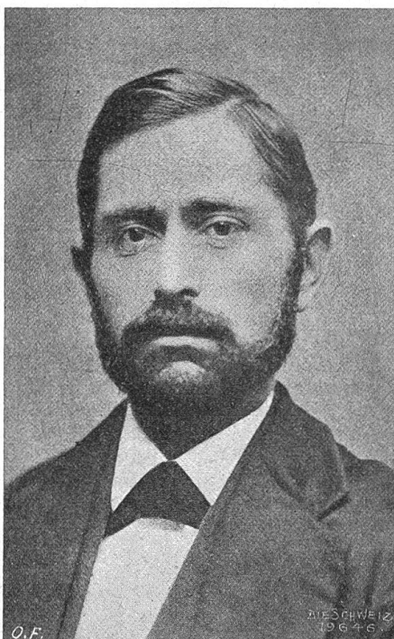
Albert (Samuel) Gatschet (1832-1907).

daß die Krim so verlassen gewesen sei, daß man nur hie und da zwei glühende Kagenaugen aus einer stehengebliebenen Fensterhöhle hervorleuchten sah. Nur die Murza, die tatarischen Großgrundbesitzer, denen eigentlich aller Grund und Boden gehörte, waren vereinsamt dageblieben. Die Kolonisten hatten die Lage rasch begriffen. Sie blieben zuhause und verhielten sich ruhig und still, um den unvermeidlichen Gang der Geschichte nicht zu stören. Und bald kam auch von da und dort ein Murza angejagt und bat, man möchte ihm doch sein Land, das er nach dem Auszug seiner Hörigen nicht mehr betreiben könne, pacht- oder kaufweise abnehmen. Unter günstigsten Bedingungen konnten nun die Kolonisten ausgedehnte Ländereien kaufen und darauf neue Kolonien gründen. Bald wurde jedoch der Zudrang in die verlassene Krim von allen Seiten so groß, daß es keinen Platz mehr gab und die Bodenpreise erreichten eine unerhörte Höhe wie nirgends im Land. Die Schweizer waren jedoch zuerst am Platz gewesen und hatten am besten abgeschnitten. Sollte heute ihr Grundbesitz von der Liquidation ausgeschlossen bleiben, so wäre das der zweite Glücksfall in ihrer Geschichte.