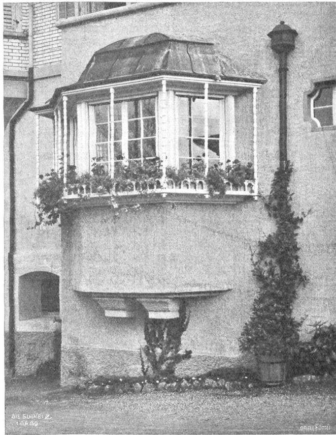
Theller & Selber, Luzern.

Abseits von der schwankenden Menge all dieser fröhlichen oder unfreiwillig komischen Menschen stehen zwei düstere,