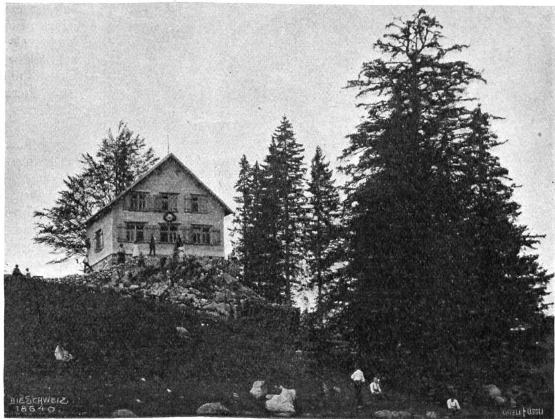
Die Bütte der Arbeiter-Naturfreunde am Säntis.

und Liebe, kaum daß sie sie zu fassen glaubt, immer wieder zerrinnen, vermag sich in dem Schwulst von hohler Theatralik und verlogenen Pathos nicht geltend zu machen. Zwischen diesen beiden robusten und lauten dramatischen Erzeugnissen stand Maeterlincs „Aglavaine und Schlysette“. Lieft man die rührende Geschichte von der armen kleinen Schlysette, die um das Glück ihres Gatten und der von ihm geliebten Frau nicht zu stören, eigenes Glück und Leben opfert, wird man wundersam ergriffen von diesen Szenen voll vibrierender Innigkeit, von dem süßen Duft, der ihnen entströmt. Aber man legt auch das Buch mit einem Zweifel an die Bühnenfähigkeit des Dramas aus der Hand; man fragt sich, werden diese stillen Zwiegespräche, durch die ein leises Beben gequälter Seelen wie das Zittern einer Saite geht,