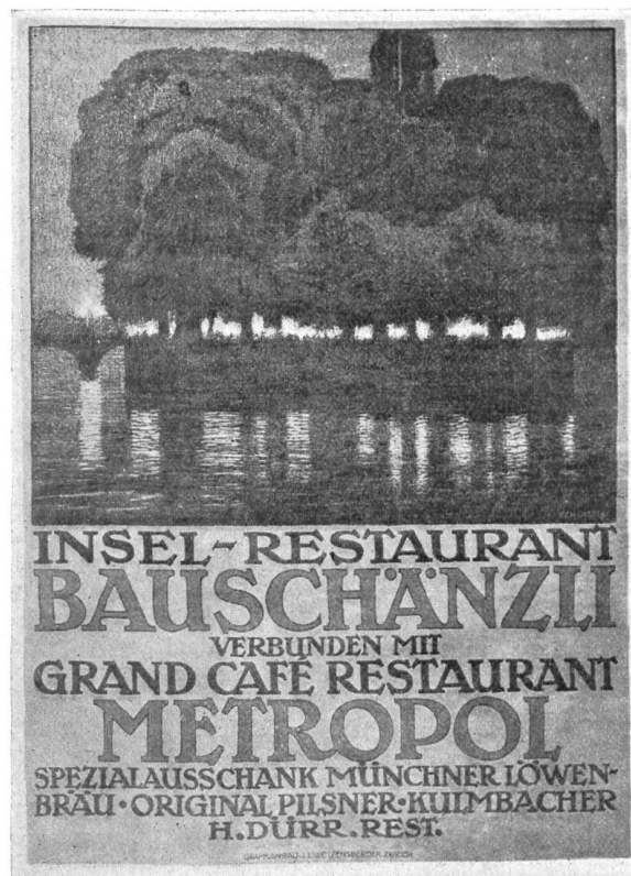
Ernst Emil Schlatter , Zürich. Plakat für das Bauschänzli-Restaurant in Zürich. Druck: Graph. Anstalt J. C. Wolfensberger, Zürich.

Ich wandere durch das Rheintor aufs offene Land hinaus. Rheinhausen ist mir lieb geworden. Ein alter, stets ehrlicher Geruch, ein ungestörtes Wohlleben und ein wackerer Menschenschlag sind an dem Städtchen hängen geblieben. In verschwiegenen Rheinhauser Kneipen mag man diese Menschen noch finden. Da hocken sie bei einem Sumpfen zusammen und reden über Tagesereignisse, bedächtig und langsam — treffend und