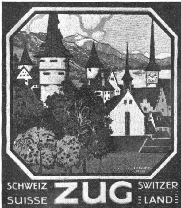
Walter Koch, Davos. Plakat für die Zuger Berg- und Straßenbahn. Druck: Graph. Werkstätten Gebr. Frey, Zürich.

Sie stritten noch eine Weile auf dem Heimweg herum, was mit dem Goldprinzlein geschehen sollte. Als sie zum Gartentore hereinkamen, watschelte ihnen