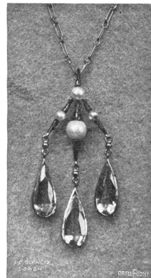
Ernst G. Stäheli, Frauenfeld. Abb. 4. Anhänger aus schwarzem Mattgold (4 Ganzperlen, 3 tropfenförmige rosa Turmaline).