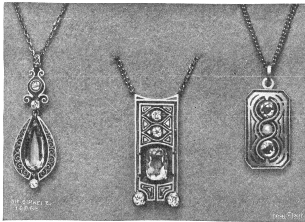
Ernst G. Stäheli, Frauenfeld. Abb. 2. Anhänger in Mattgold: a) aus glattem und gefebtem Golddraht mit Spiralornament (tropfenförm. Aquamarin, 3 Brillanten, Fassung Platin); b) aus glattem und gefebtem Golddraht mit Dreieck-Linieneinführung (viereckiger Aquamarin, 4 Brillanten, Fassung Gold); c) aus gefebtem Golddraht, Fassung Goldblech mit à jour-Ornament (2 Saphire, 1 Perle).

mit gleichzeitiger Belegung von Kursen im Zeichnen und Modellieren. Nach Erledigung der Lehrzeit kam er für ein Jahr zu Ponti-Gennari nach Genf, wo er Gelegenheit fand, sich im Entwerfen und Modellieren auszubilden. Unter Eugen Dufler in Firma Bossart & Cie. in Zürich wurde er in die Juwelenausscherei eingeführt. Eine einjährige Etappe bei Ponti-Gennari (Zweiggeschäft von Genf) in Paris verschaffte ihm nicht nur Gelegenheit, selbständig entwerfen und ausführen zu können, er lernte auch die Arbeiten der Pariser Meister, eines Fouquet, Boucheron, Bever und Lalique kennen. Ein fünfjähriger Aufenthalt in Dresden beim Gravier- und Zeichenlehrer Robert Neubert sowie die Belegung eines Kurses über Steinkunde am geologischen Institut in Bern vervollständigten sein Studium. 1912 zog Ernst G. Stäheli wieder in seine Vaterstadt zurück. Seit dieser Zeit ist er bestrebt, seine Ideale zu verwirklichen. Viele gute Erzeugnisse sprechen für sein Wissen und Können, sie kom-