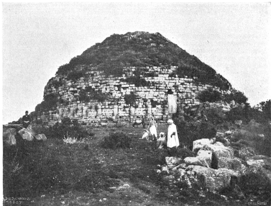
Das «Grab der Christin» (Mausoleum Zuba's II.) im alten Mauretania (S. Algerien).