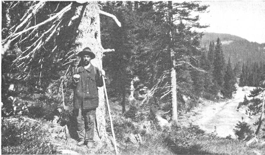
Schanfiggtaler auf der Pirsch.

Eines verschwieg er ihr ganz: sein ehemaliger Meister war ihm äußerlich etwas vernachlässigt vorgekommen. In solch schäbigem Aufzug hätte er sich vordem nicht außer Dorfes sehen lassen.