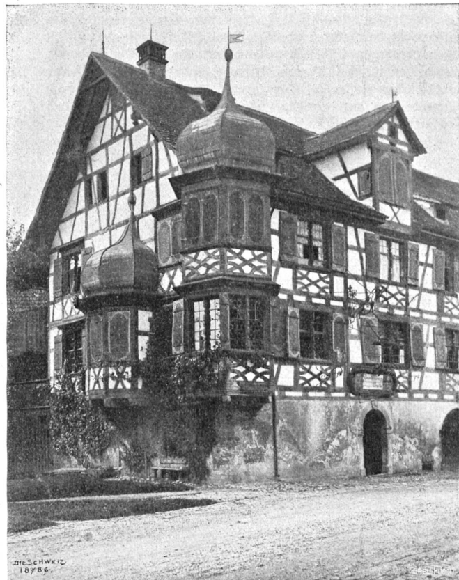
«Drachenburg» zu Gottlieben im Thurgau.

glaubte man, er diktire ein Todesurteil, und wenn er um Feuer bat, so meinte man, Wallenstein beschwöre Max Piccolomini. Er war gerade dabei zu erzählen, wie er, ein blutjunger Anfänger in Dresden, für den erkrankten Devrient als Othello habe einspringen müssen und so hinreißend gespielt, daß das Publikum nichts von der Stellvertretung