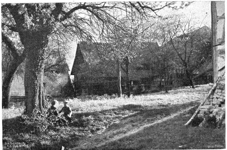
Gerlikon bei Frauenfeld. Beträumer Dorfwinfel.