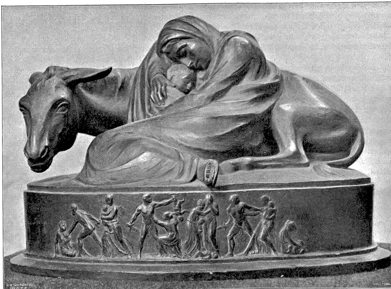
Ruhe auf der Flucht nach Ägypten. Bronze (1900) von Eduard Zimmermann, Stans-München.