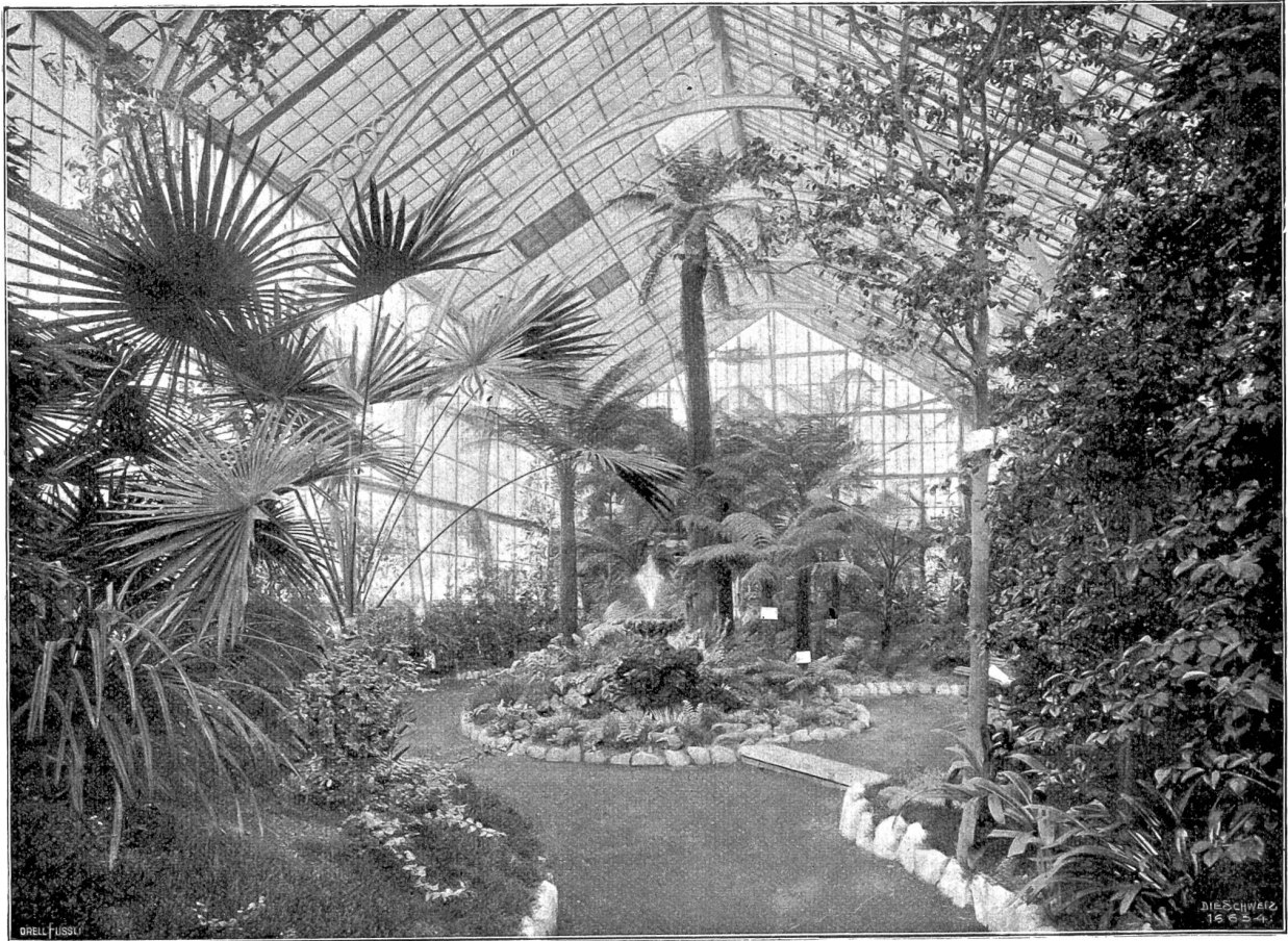
Aus dem Rotterdamer Tiergarten. Das große Pflanzenhaus mit Baumfarngruppe.

der zu sterben entschlossen war, wagen, das Wort Verräter auf Falcone anzuwenden; ein wohlgezierter Dolchstich, der nicht wiederholt zu werden brauchte, würde die Beschimpfung sofort heimgezahlt haben. Diesmal rührte sich Mateo kaum: nur griff er mit der Hand nach der Stirn wie ein schwergetroffener Mann.