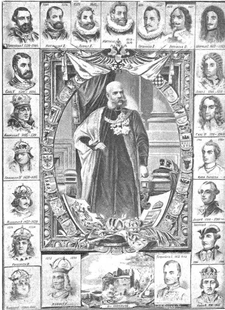
Genealogische Tafel der Herrscher aus dem Hause Habsburg, von Rudolf I. (1273—1291) bis auf Franz Joseph I., den gegenwärtigen Kaiser von Oesterreich seit 1848, nach dem Tableau auf der Habsburg.

und der Erbauer der Habsburg. Auf ihn und seinen Bruder wird auch die Gründung der Burgen Wildegg und Brunegg zurückgeführt. Diese Burgengründungen hatten den Zweck, die an der Grenze gegen das damalige burgundische Reich gelegenen Gebiete zu schützen; namentlich die Habsburg diente diesem Zwecke, da sie von ihrem freien, weitausschauenden Standpunkte die durch das Land führenden Straßen weithin überblickte — und ihrem Namen als Habichtsburg alle Ehre machte. Der auf die Habsburg verpflanzte Zweig der Grafen von Altenburg nannte sich nach dem neuen Sitze, und in den zwei fol-