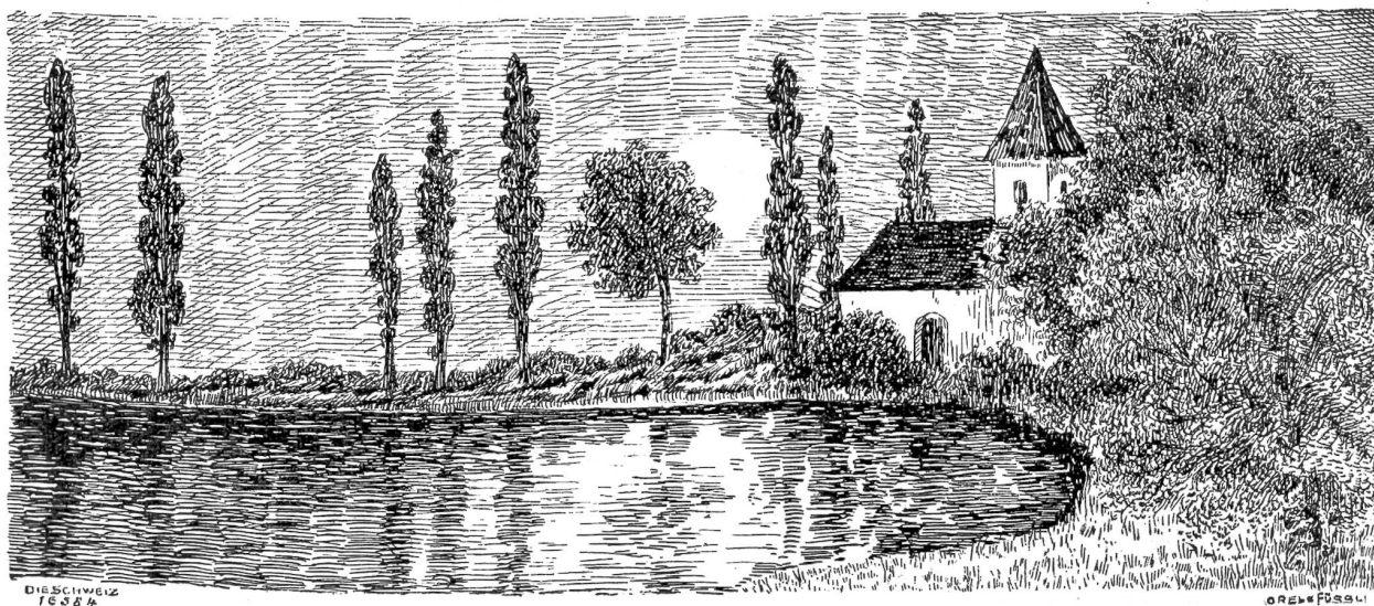
Mondnacht. Nach Federzeichnung von Olga Amberger, Zürich.