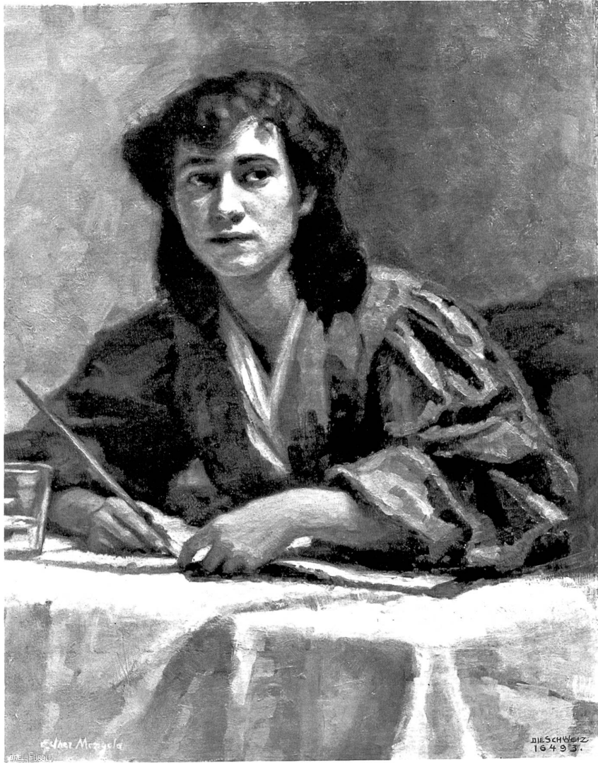
Malendes Mädchen. Nach dem Gemälde von Esther Mengold, Basel.