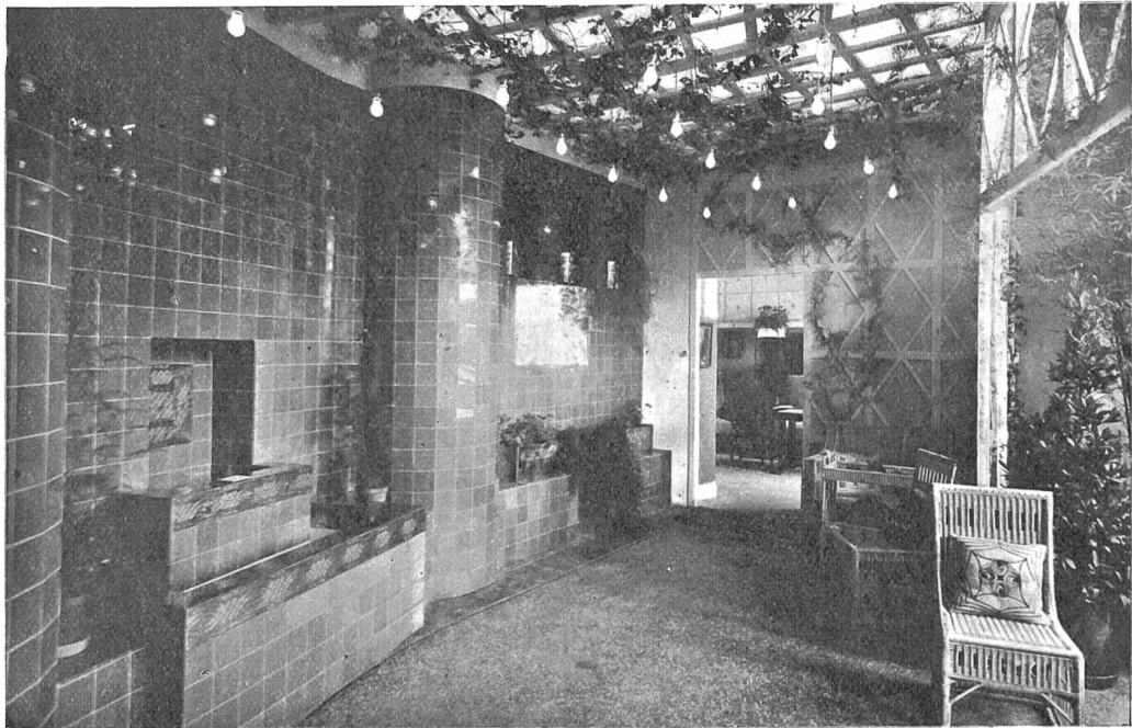
Pergola, entworfen und ausgeführt von Gebr. Lindt, Zürich.

Als sie seinen Schritt im Flur hörte, erwachte sie aus der Lethargie und lauschte ganz verzückt. Als er eintrat, schaute