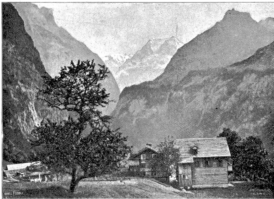
Vom Ristenpaß. Kurhaus Obort.

der Gießbach milchweiß durch die Felsenwüste. Vor uns steigt finster, fast schwarz der Hinterberg empor, an dessen Fuß sich die verlassene Sennhütte schmiegt. Gegen Osten wird die verschneite Spitze des Schwarzhorns sichtbar; leichte Nebel schweben um sie her. Rechts oben steht einsam, todesstarr die schroffe, mitten wie von Gigantenhand entzweigespaltene Similwand. Unsere Blicke messen die Höhe der Felsen zwischen ihr und dem Hinterberg, die wir ersteigen müssen, und verfolgen die schmalen Rasenbänder, über die wir in fortwährenden Kehren und Kletterpartien den Weg nehmen werden. Wir gedenken des herrlichen Sonntagmorgens, da wir den Plan unserer Faulhorntour hier faßten und selig im Grafe ruhten.