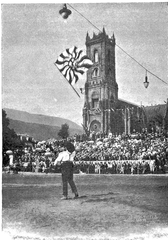
Schweiz. Schwing- und Helplerfest zu Neuenburg. Fahnenparaden.

lebensfrischen Gesinnung der Verfasserin stehen in der „Widmung“ des Bändchens die auch uns zur Mahnung gesprochenen Worte: