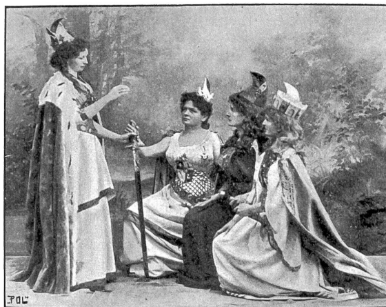
Szene aus dem Festspiel auf dem Dolber.

Es liegt zweihundert Meilen hinter dem Ende der Welt, und ein dreihundert Meter dicker Wall von Grütze umgibt das-