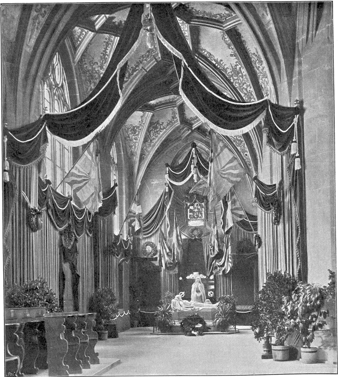
Die Steiger-Kapelle im Münster zu Vorn, am 5. März 1898.

Das klang wunderbar, fast biblisch. Der Klang der ehernen Glocken mußte meine Seele berührt haben. Und ich hörte wieder seltsame Töne um mich, als schrien und sprächen die Donnerschläge der Kirche allein für mein glaubensleeres, gottloses Herz. Und im Schweigen, mit halbgeschlossenen Augen, ging ich neben ihr