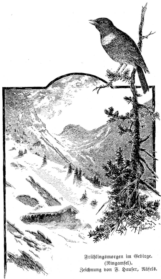
Frühlingmorgen im Gebirge. (Ringamsel). Zeichnung von F. Haufer, Näfels.