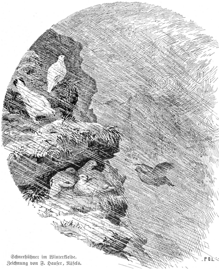
Schneehühner im Winterkleid. Zeichnung von F. Hauser, Näfels.

Das Steinhuhn zeichnet sich nicht allein durch besondere Schönheit, sondern gleichermaßen auch durch Klugheit, Scharfsinn und Behendigkeit sehr vorteilhaft vor allen besprochenen Hühnerarten aus. Es lernt den Jäger sehr wohl vor dem ungefährlichen Hirten unterscheiden, und nicht jeder größere vorüberfliegende Vogel versetzt es in kopflose Angst und Furcht, wie solches bei vielen seiner Verwandten geschieht. Auf den Felsblöcken klettert es mit erstaunlicher Sicherheit umher. Sein Flug ist rasch, geräuschlos und gerade, aber nie lang. Es macht nur ausnahmsweise Gebrauch von seinen Schwingen, wie es auch nur im Nothfalle in Bäume, in Wettertannen flüchtet. Gewöhnlich versteckt es sich im Gestein und zwar so rasch und gut, daß von einer beunruhigten Gesellschaft augenblicklich nicht ein Stück mehr zu sehen und trotz allem Suchen auch nicht eines mehr zu erpähen ist. Am regsten ist die Bernise früh am