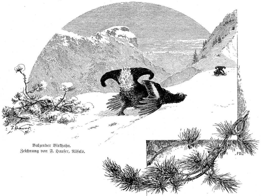
Balzender Birkhahn. Zeichnung von F. Hauser, Käfels.

Wie der düster und schlicht gefärbte Auerhahn der größte und stärkste, so ist der Spielhahn unstreitig der schönste, der