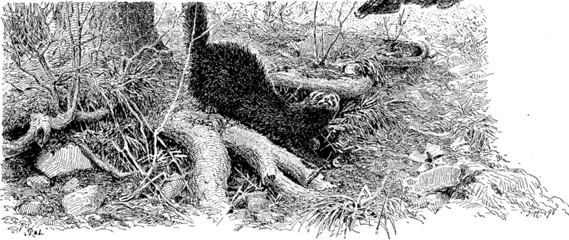
Hafelhuhn und Hais. Zeichnung von F. Hauser, Käfels.

Der balzende Birkhahn ist schwerer zu erlegen, als der balzende Auerhahn. Die lokalen Verhältnisse des Gebirges gestalten seine Jagd mühsamer, mancherorts geradezu gefährlich. Sie erfordert kräftige, allen Unbilden der Witterung trotzende, in den Bergen wohl bewanderte Naturen, größte Ausdauer, Gewandtheit und Geduld. Zum Wertvollsten was es zu ihr braucht, gehört, nächst einer guten Flinte und genauer Kenntnis der Vertikalität, die Nachahmungsfähigkeit des Kampfrufes, des „Blasens“. Der verliebte, eiferfüchtige Geselle wird damit getäuscht. Fliegend oder laufend nähert er sich in blinder Wut der verhängnisvollen Stelle, von wo er den Ruf des vermeintlichen Gegners vernahm. Ist der Schütze seines Zieles sicher, dann hat der Hahn an diesem Morgen zum letzten Mal der Liebe Lust und Schmerz gekostet. In vielen Fällen bleibt das Resultat des „Abblasens“ aber ein negatives. Der Jäger hat sich dann durch Anhschleichen dem balzenden Vogel auf Schutzweite zu nähern, was bei dem scheuen, wilden Tiere stets ein äußerst mißliches Unternehmen bleibt.