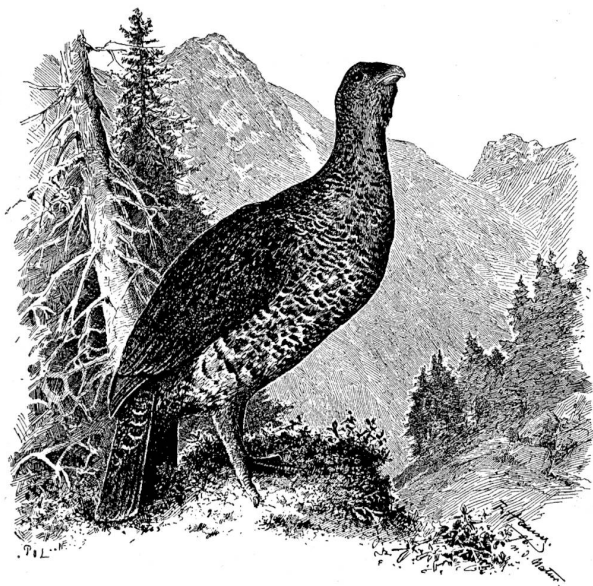
Auerhahn. Zeichnung von F. Hauser, Näfels.

Hähne, deren ganzes Wesen und Treiben ein völlig verändertes ist, zu den sonderbarsten und tollsten Liebesgefängen und Liebestänzen und zu den heftigsten Kämpfen an. Das Liebespiel, welches speziell beim Auer- und Birkwild ausgeprägt ist, bezeichnet man mit „Balz“ oder „Falz“. Die Jagd der größeren Wildhühner während dieser Periode bietet dem Waidmann einen ebenso hohen Genuß, als die Erlegung des stattlichsten Kapitalhirschen, und sie wird daher auch von allen Ständen, von gekrönten Häuptern wie vom schlichten Bauer und Berufsmann mit der nämlichen Leidenschaft betrieben.