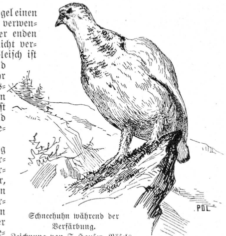
Schneehuhn während der Verfärbung.

Allem, was die Hühner zu ihrer Erhaltung brauchen, so kläglich bestellt. Auf Stundenweite kein Strauch, keine Tanne, die ihnen Schutz vor den Unbilden der Witterung böte; die Nahrung so karg, Insekten und Beeren so spärlich, und dazu deckt dies wenige so oft im Jahre noch hoher Reif und Schnee. Der Winter treibt das Alpenschneehuhn in tiefere Lagen, bis zu den mittleren Alpstaffeln herab, wo es sich in Scharen von über 20 Stück zusammenhält. Jährlich verendet eine große Zahl. Sie erliegen der Kälte, dem Hunger, und über ganze Familien, die etwa unter vorstehendem Gestein, oder unter dem Geäst niedrigen Nadelholzes besammetauerten, wölbt ein Schneegestöber, oder eine Lawine den Grabhügel.