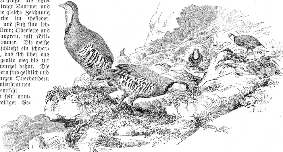
Steinhühner. Zeichnung von F. Hausser, Näfels.

Ebenso farbenprächtig und nett, in der Hauptsache nur durch die vorherrschend rötlichere Färbung und den breiteren, gegen abwärts in Flecken aufgelösten Kehlsaum vom Steinhuhne verschieden, ist sein nächster Verwandter, das Rothuhn, welches die Reihe der alpinen Wildhühner, unter denen es die geringste Verbreitung hat, beschließt. Es findet sich nur in Tessin und Wallis, ist weniger ausgeprochen als die Bernise