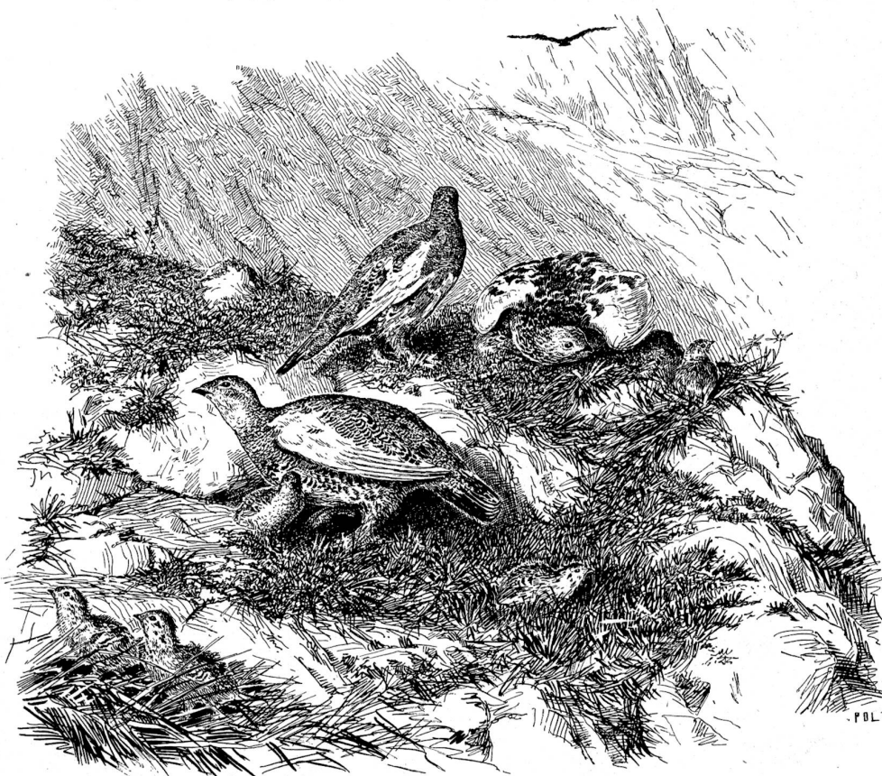
Schneehühner im Sommerkleid. Zeichnung von F. Hausser, Näfels.