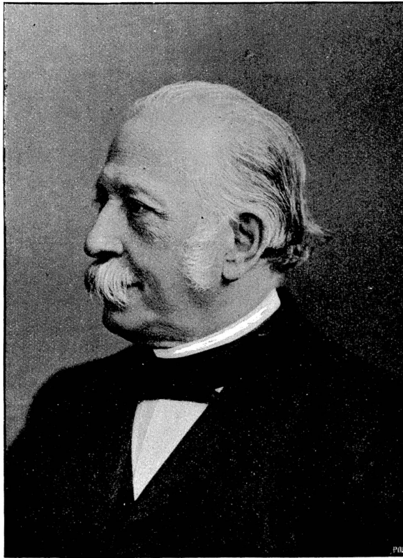
Theodor Fontane.