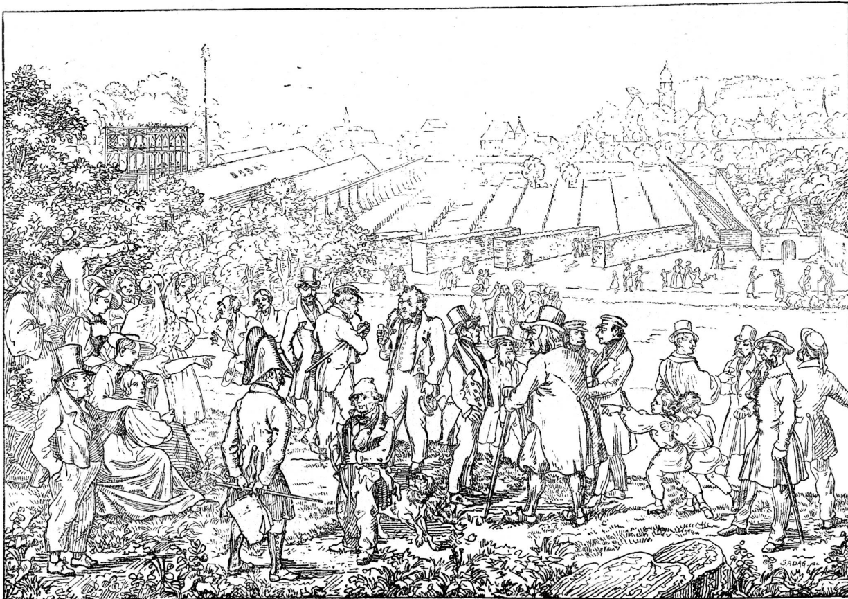
Eidgenössisches Freischießen in Solothurn (1840). Nach Distel.

Erde. Die runden nackten Beinchen zappeln über dem hohen Niedgras. Dann bleibt das zweite stehen, läßt das Mäulchen