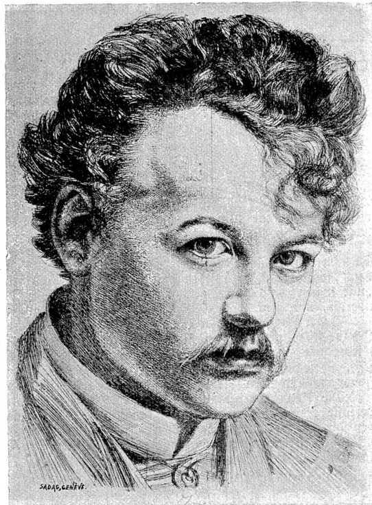
Selbstporträt Karl Staufers. Nach einer Radierung.

Eine grüne Wiese. Und in der grünen, sonnenbeschienenen Wiese zwei große, farbige Flecken, ein roter und ein blauer. Die Flecken bewegen sich. Sie werfen blaue Schatten, die langgestreckt über die Wiese laufen. Jetzt nähern sie sich. Die zwei Flecken verwandeln sich in zwei kleine Kinder. Zwei winzige runde Geschöpfchen. Sie haben beide hellblondes Kraushaar und weit offene blaue Augen. Sie halten sich an den dicken Händchen und zotteln eifrig vorwärts. Aber die Sache ist nicht leicht. Bald liegt das eine, bald das andere auf der