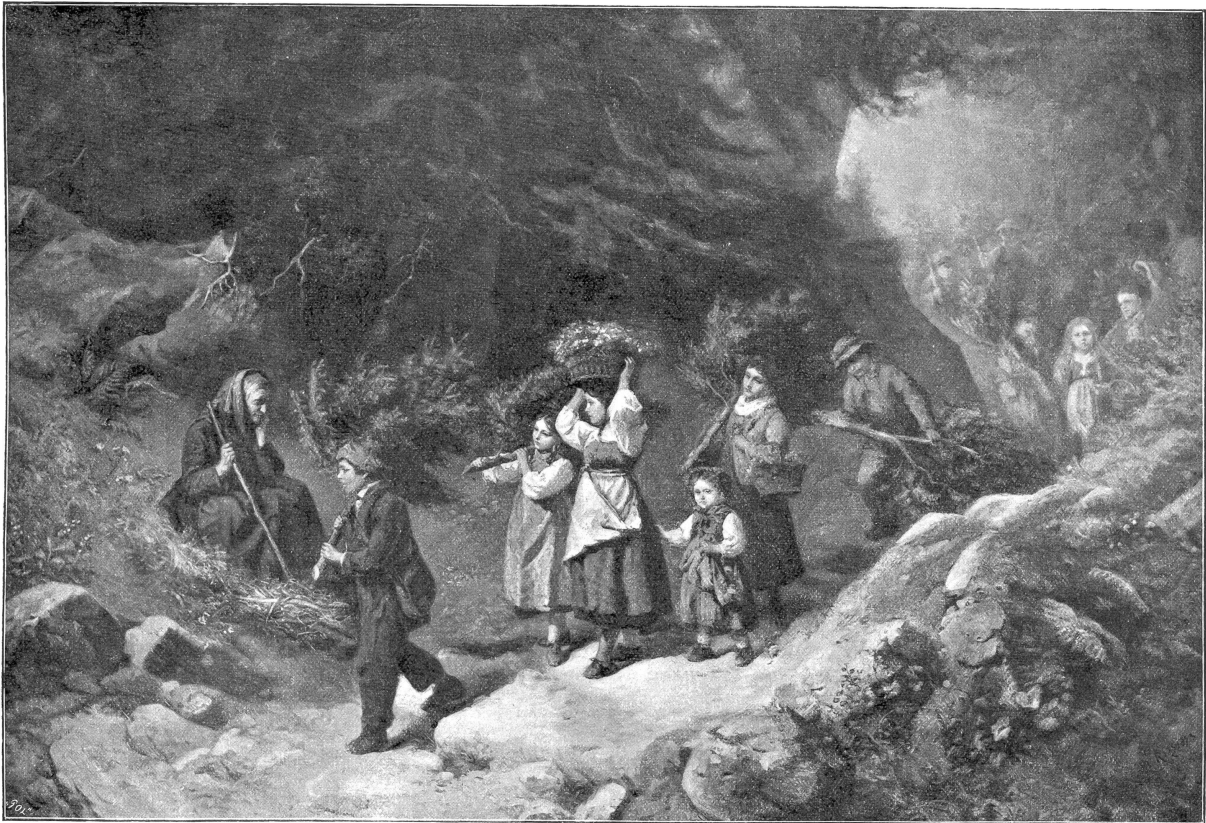
*** Vorbereitungen zum Feste. *** Gemälde von Michael Sittler.