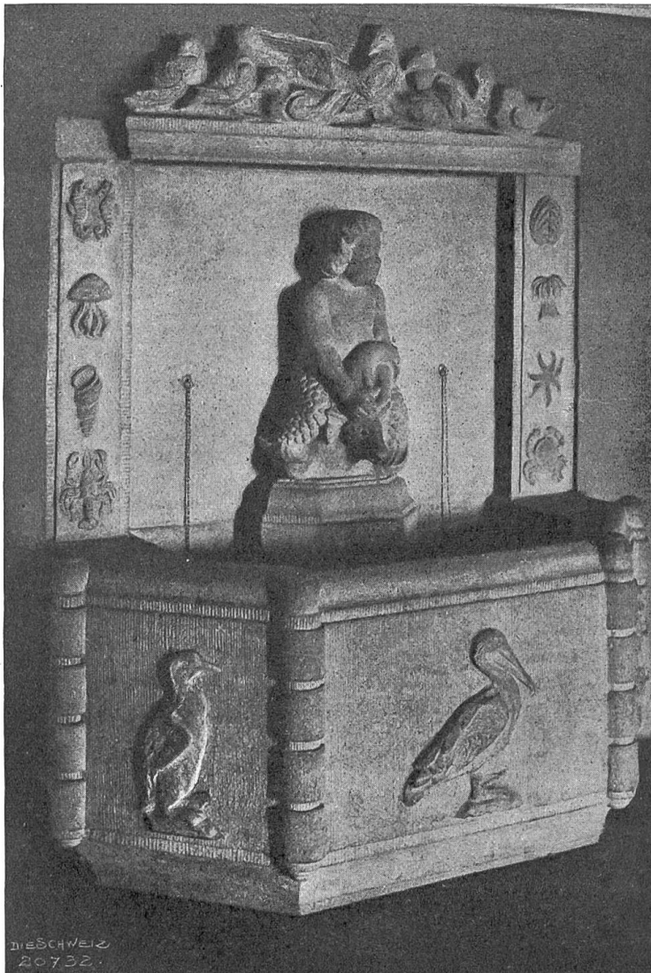
Ida Schaer-Krause, Zürich Brunnen am Schulhaus in Cham (1917). und Architekten Kneel & Häfzig, Zürich.

scheiden mußte, ob überhaupt ein regelmäßiger Theaterbetrieb unter den durch den Krieg verursachten Verhältnissen noch weitergeführt werden könne. Die Frage wurde schließlich nach langen, mühsamen Verhandlungen mit dem Gemeinderate, der das gewichtigste Wort in diesen Dingen spricht, bejaht, zugleich allerdings beschlossen, durch Einschränkungen, die vor allem die große Oper betreffen, die Ausgaben wesentlich zu verringern. Inwieweit dadurch auch die Einnahmen verringert werden, wird das nächste Spieljahr lehren. Der Gemeinderat hatte die Zulassung eines Theaterbetriebes 1921/22 einfach davon abhängig gemacht, daß ein gleichschwebendes Budget hergestellt werde, das genügende Sicherheit biete. Schon aus dieser Tatsache mag man ersehen, daß das Berner Stadttheater in Tat und Wahrheit, wenn auch nicht formell, ein städtisches Unternehmen ist. Das Gebäude, in dem gespielt wird, gehört der Stadt, und nur durch die Subventionen, die aus dem Stadtsäckel fließen, kann der Betrieb ermöglicht werden. Eine Gesellschaft, die das Theater führt, existiert sonderbarerweise nicht. Der Gemeinderat hat einen Verwaltungsrat gewählt, der einzig ihm verantwortlich ist, und so fallen letzten Endes