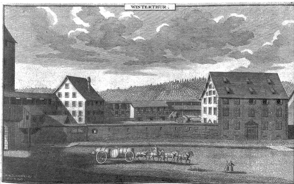
Dieses Amtshaus gehörte vor allem dem Kloster Rütli, ein Amtmann verwaltete das Gericht. Herr zu Nefflenbach, nimmt sich der Stadt Sache nichts an, aufert das er sint a. 1668 neben dem Türchischen Pfarrer ihrem Ulani oder Huldigungstag bejwohnet, bis die ganze Bürgerschaft den Eid der Treu gegen der Stadt Zürich abgelegt; Das Amtshaus ist a. 1731. 1739. und 1780. erweitert und gar schön erneuert u. gebaut worden.