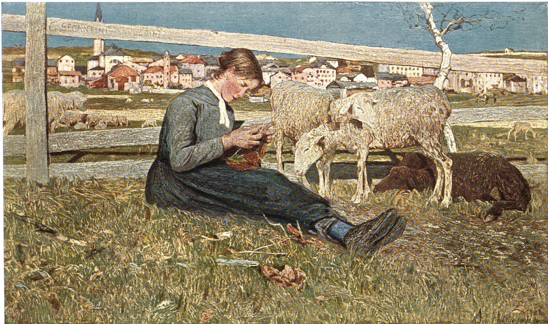
Giovanni Segantini (1858—1899).