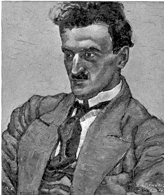
Paul Donzé, Neuenburg-Florenz. Bildnis des Malers Octave Matthéy. Ölgemälde (1917). (Museum Neuenburg).

kunst entwickeln möge, mehr als dies bisher der Fall war, und er will sein Möglichstes dazu beitragen.