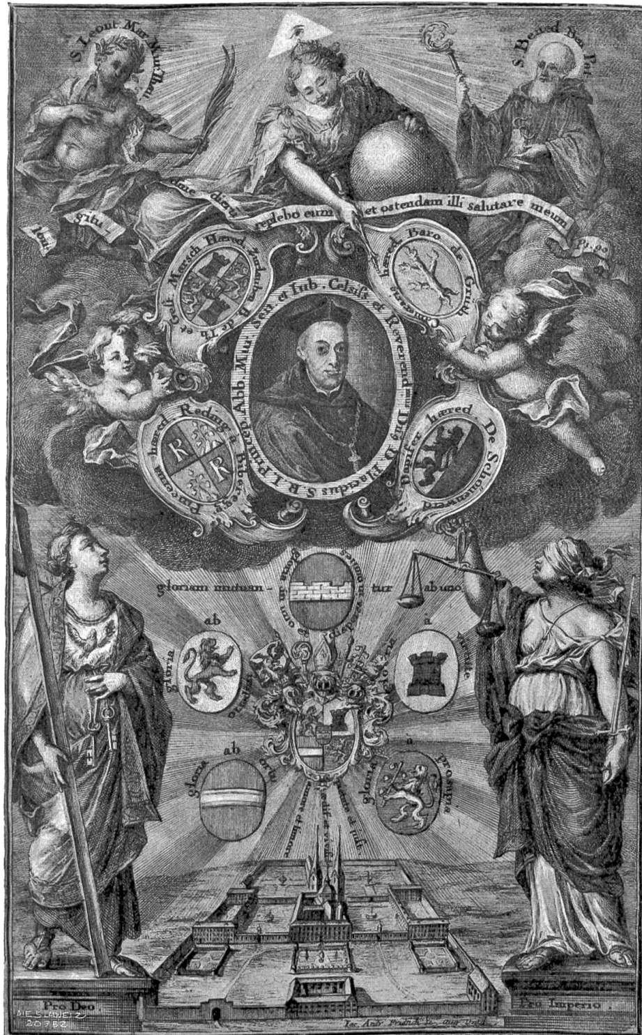
Gedenkblatt zum fünfzigjährigen Priesterjubiläum des Fürstabtes Placidus im Benediktinerkloster Muri (1720).

nicht vorkommt. Dieses par nobile fratrum stammte aus Zug vom altberühmten Geschlechte der Zurlauben, das dem Lande eine große Zahl von Beamten, Militärs und Welt- und Ordensgeistlichen schenkte. Das Fehlen des Namens Zurlauben erklärt sich wohl daraus, daß dieser Name nicht den eigentlichen Adelstitel enthielt, sondern nur ein Zuname derer zum Thurn und Gestellenburg war.