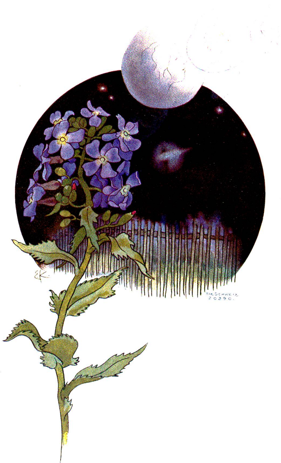
Ernst Kreidolf, Bern. Nachtviole, Aquarell.

Sternenglanz und Duft der Nachtviolen — Die müde Brust fühlt Heimwehsehauer; Die Träume gehn auf unhörbaren Sohlen. Adolf Frey. (Aus „Blumen“, Nötornelle)