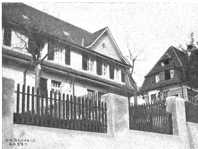
Adolf Freys Heim an der Mommsenstraße in Zürich.

Es war Fräulein Meyer. Er erkannte sie gleich an ihrer weißen Bluse. Sie kam mit eiligen Schritten auf ihn zu, es gab kein Entrinnen. Gusteli fühlte sich wieder, vom Kopf bis zu den Füßen gefrieren und