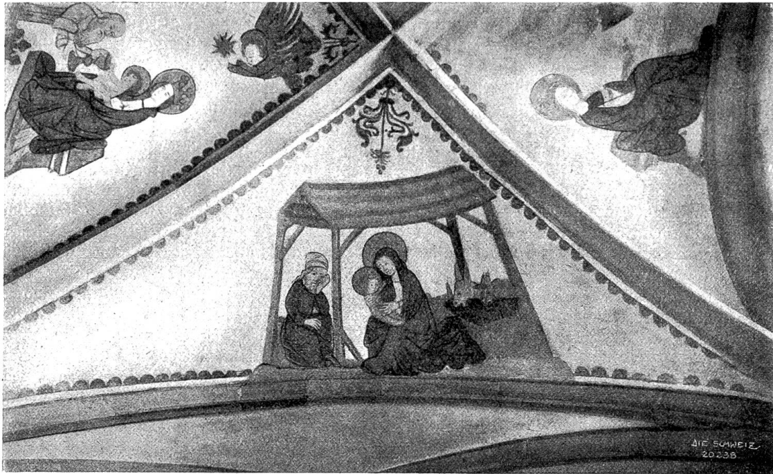
Vom Basler Münster Abb. 6. Geburt Christi u. Fresken am östlichen (mittleren) Gewölbe der Krypta (Anfang des 15. Jh.'s).

erzählte Anselm von Canterbury in seinen Meditationen, wie Jesus am Kreuz die Arme ausbreite, um uns zu umfassen, wie er das Haupt neige, um uns zu küssen, und wie sein geöffnetes Herz seine ganze Liebe zu uns zeige. In der hl. Brigitte kommt Maria selber und erzählt ihr ihr Leiden mit furchtbaren Schilderungen der Qualen Christi. Die Hymnendichter und Prediger, die Mystikerdichter und Künstler versenken sich in die Details der Passion; man zählt die Rutenstrieche Christi. Jede Stunde des Tages ruft ein Leiden in Erinnerung, man schwelgt in der Vorstellung der Qualen, aber man weiß auch die rührendsten Erzählungen vom Kreuzweg und von der Klage Mariä. Man dichtet Hymnen auf Lanze und Dornenkrone, die erst in gotischer Zeit dargestellt wird; Engel zeigen unter Trauern und Klagen die Passionsinstrumente; ja, es entsteht ein eigener Kultus der Wunden Christi. Gläubige sollen das Blut aus den Wunden