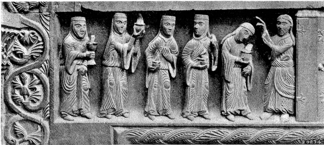
Vom Basler Münster Abb. 2. Christus und die klugen Jungfrauen, Relief am Türsturz der Galluspforte (f. Abb. 1).

dekorative Vorbilder liegen den verschiedenen Kapitellformen zugrunde.