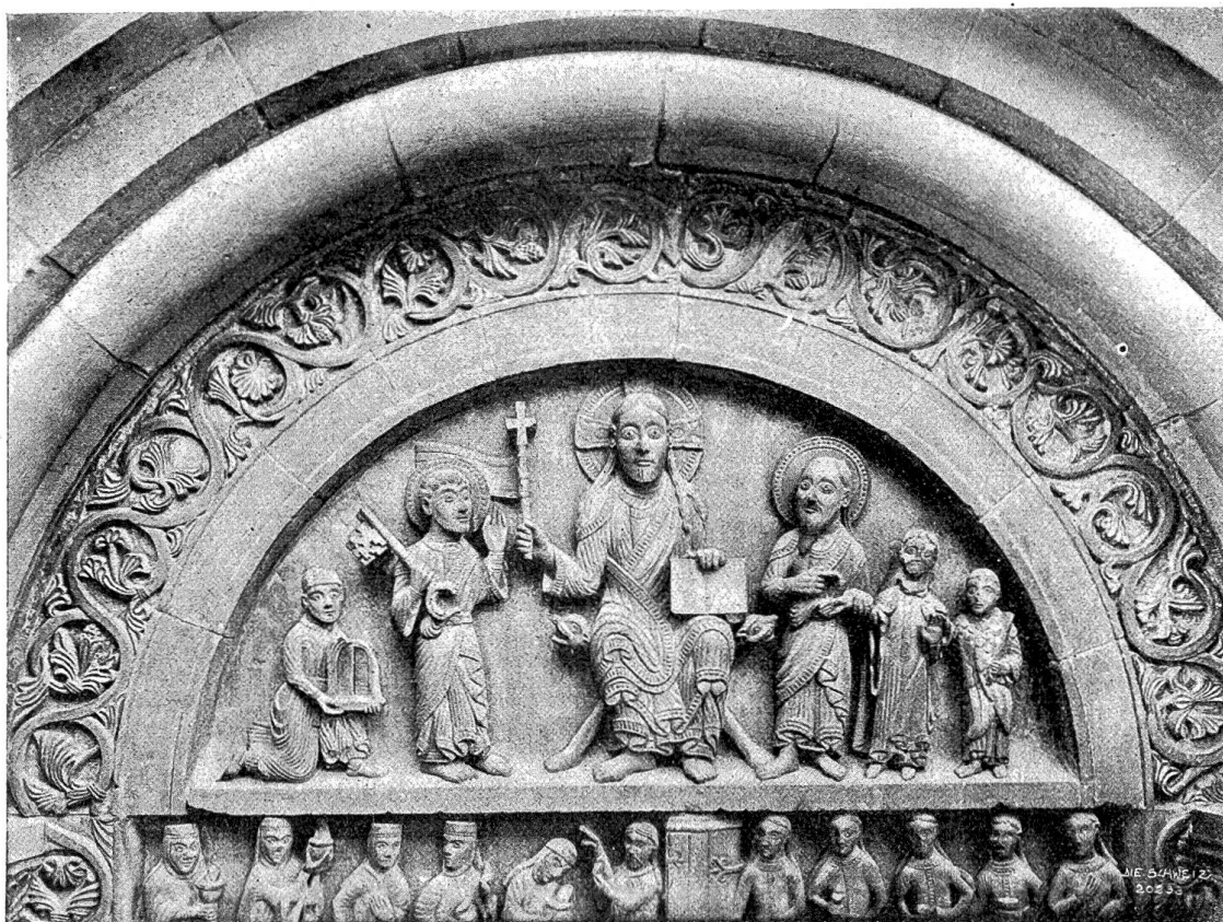
Vom Basler Münster Abb. 1. Tympanon der Galluspforte (c. 1180). Oben: Christus thronend zwischen Petrus, Paulus und den Stiftern; unten: l. Christus und die klugen Jungfrauen (vgl. Abb. 2), r. die törichten Jungfrauen.