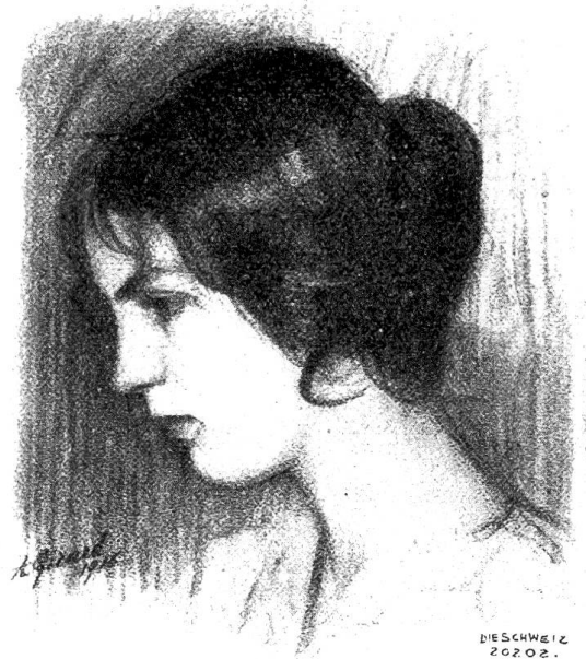
Arthur Girard, Grenchen. Weiblicher Studienkopf, Zeichnung (1916).

Und da war auf einmal ein goldenes Tor. Das ging auf, und eine wunderschöne Frau kam heraus. Die hatte goldene Haare bis auf den Boden, und oben auf trug sie einen glänzenden Reif. Die Frau kam auf den Fredi zu und beugte sich zu ihm. Sie schaute ihn an aus zwei Augen, die waren so klar und hell wie zwei Bergseelein, und der arme Bub bettelte: „Du, nimm mich mit, ich möchte so gar gerne einmal in den Himmel, wo