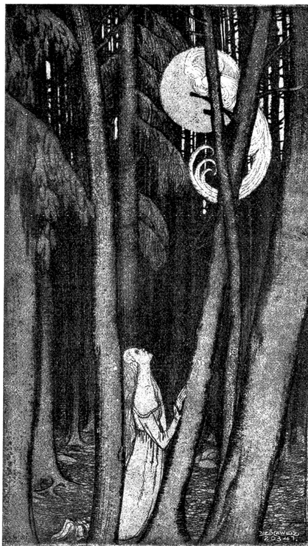
Fritz Gilsi, St. Gallen.

schwebt eine wunderfame Ruhe; auf den verwit-