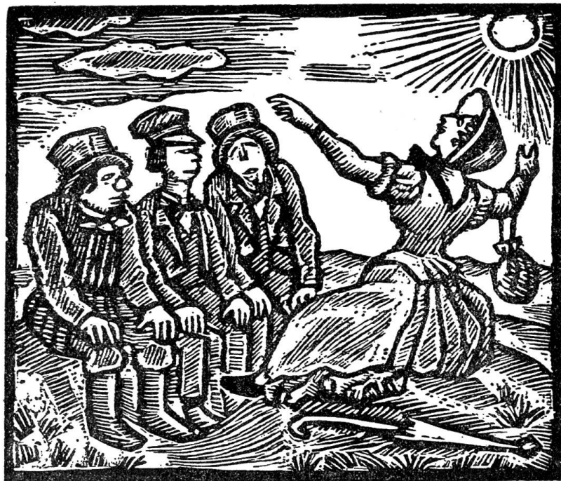
Ernst Würtenberger, Zürich. Die drei gerechten Kammacher und Züs Bünzlin. Holzschnitt.

So hat der Künstler mit seinen acht Illustrationen ein köstliches Werk geschaffen, das mit der unvergänglichen Erzählung Kellers eine Einheit an Gesinnung, ursprünglicher Kraft und künstlerischem Vermögen bildet, wie man sie nur in seltenen, besonders glückhaften Fällen an-