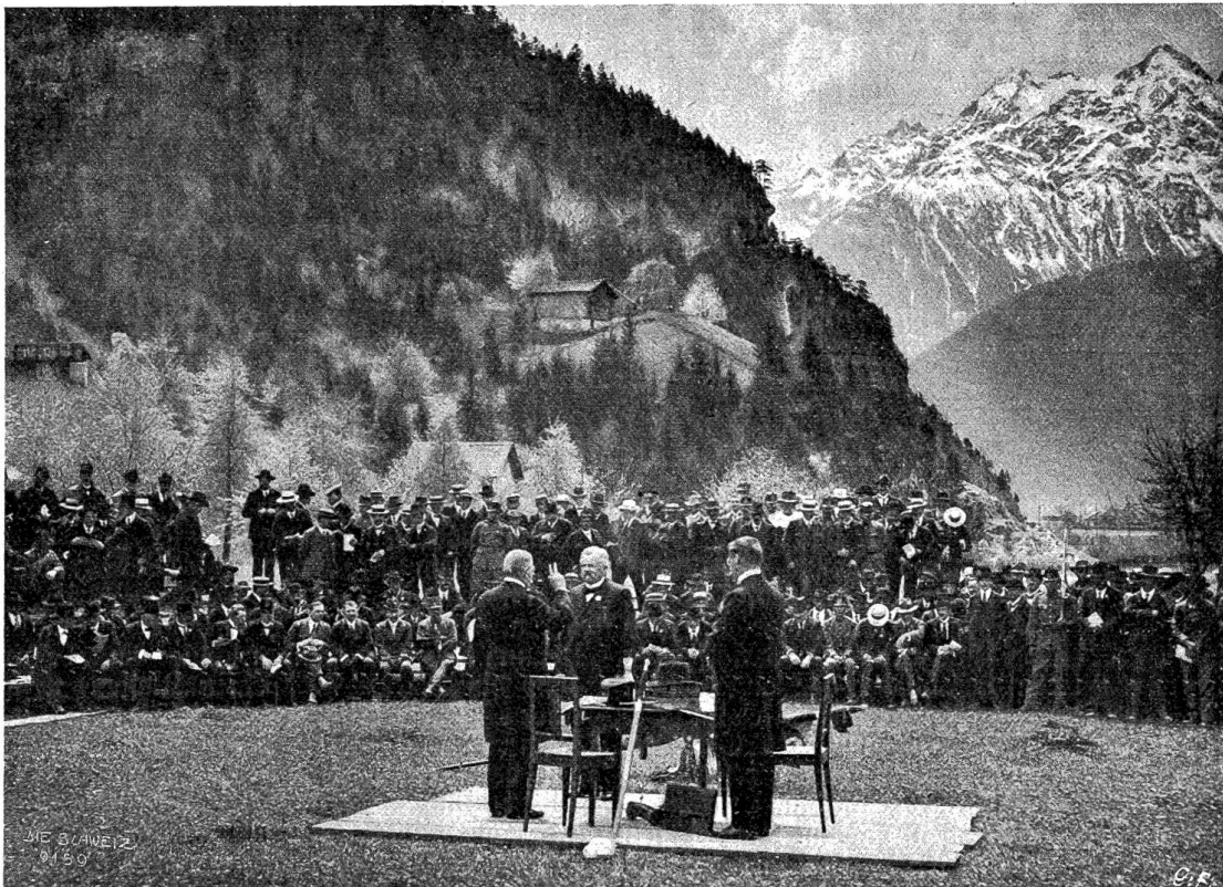
Die Urner Landsgemeinde in Altdorf. Der wiedergewählte Landammann leistet den Eid.

Die Verhandlungen in Paris hatten in den letzten Wochen eine unliebsame Störung dadurch erfahren, daß Italien sich zeitweise in den Schmollwinkel zurückzog, weil seinem Begehren um Annexion der Stadt Fiume nicht ohne weiteres entsprochen wurde. Präsident Wilson richtete noch eine besondere Botschaft an das italienische Volk, in der er dieses ermahnte, den Prinzipien, die es selber beim Eintritt in den Krieg verkündet hatte, nicht untreu zu werden und auf gewaltsame Annexionen zu verzichten, umso mehr, als jetzt nicht mehr Oesterreich-Ungarn, das zu existieren aufgehört hat, sondern das befreundete Jugoslawien von einer solchen Annexion betroffen würde.