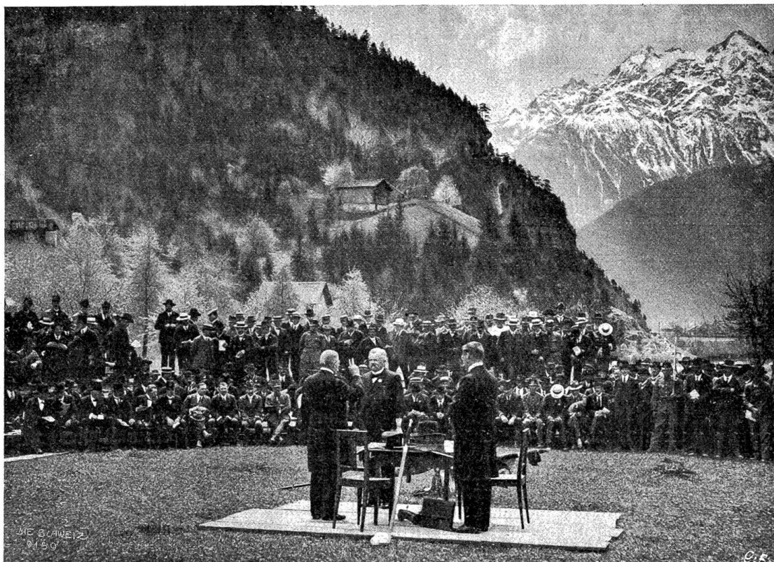
Die Urner Landsgemeinde in Altdorf. Der wiedergewählte Landammann leistet den Eid.

Die Verhandlungen in Paris hatten in den letzten Wochen eine unliebsame Störung dadurch erfahren, daß Italien sich zeitweise in den Schmollwinkel zurückzog, weil seinem Begehren um Annexion der Stadt Triume nicht ohne weiteres entsprochen wurde. Präsident Wilson richtete noch eine besondere Botschaft an das italienische Volk, in der er dieses ermahnte, den Prinzipien, die es selber beim Eintritt in den Krieg verkündet hatte, nicht untreu zu werden und auf gewaltsame Annexionen zu verzichten, umso mehr, als jetzt nicht mehr Oesterreich-Ungarn, das zu existieren aufgehört hat, sondern das befreundete Jugoslawien von einer solchen Annexion betroffen würde.