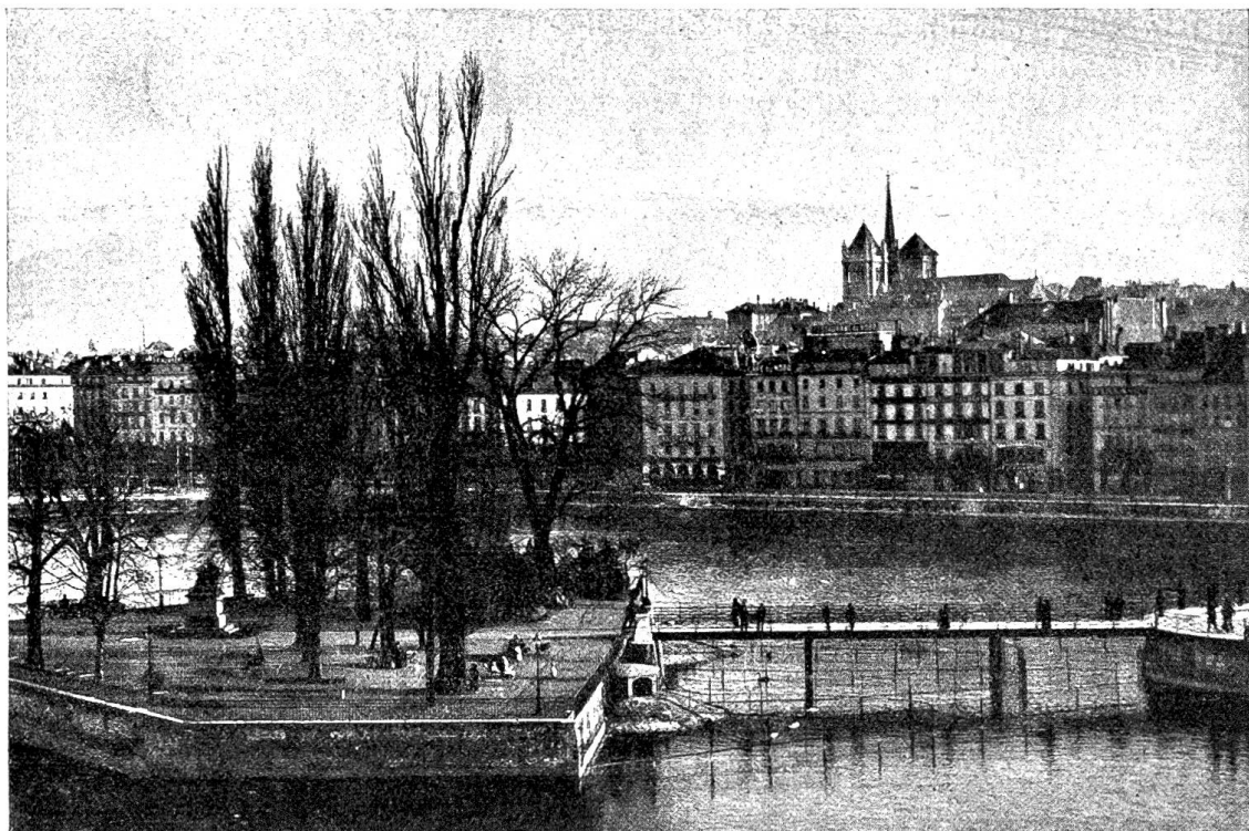
Die Stadt Genf, die zum künftigen Sitz des Völkerbundes erwählt worden ist.

Das noch ganz von imperialistischem Geist erfüllte italienische Volk nahm die Botschaft Wilsons sehr unwillig auf, und die Kammer erteilte den aus Paris zurückgekehrten Staatsmännern ausdrücklich ein Vertrauensvotum. Die Konferenz der Alliierten ließ sich indessen durch diese italienische Extratour nicht beirren, sondern setzte ohne Italien ihre Arbeit fort und lud auf den 12. Mai auch die österreichischen Delegierten zum Friedensschluß nach St. Germain-en-Laye ein. Dieser Umstand war es hauptsächlich, der dann die Italiener bewog, schleunigst nach Paris zurückzukehren, ohne vorher, wie sie ver-