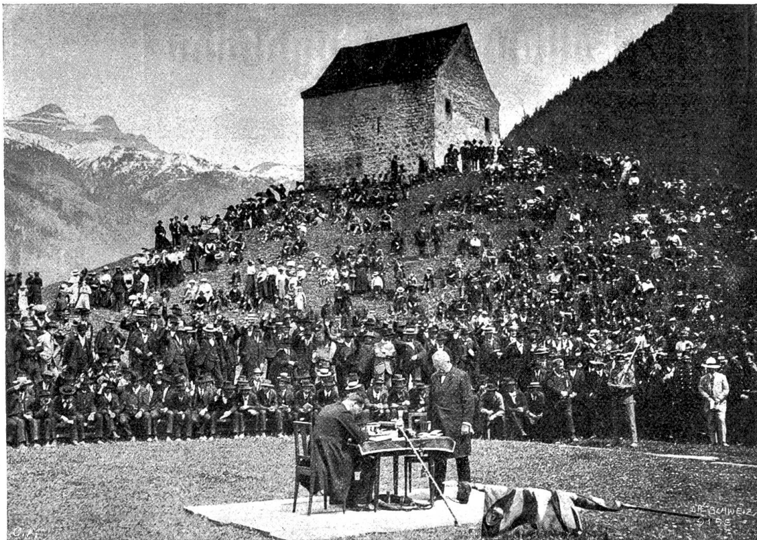
Die Urner Landsgemeinde in Bözlingen an der Gand bei Altdorf (im Ring stehend der in seinem Amte bestätigte Landammann).

gedacht ist, überhaupt beitreten kann oder nicht. Sollte die Antwort auf diese Frage am Ende aller Enden verneinend ausfallen, so fiel natürlich auch die Wahl Genfs als Sitz des Völkerbundes wieder dahin. Entscheidend für den Beitritt oder Nichtbeitritt der Schweiz zum Völkerbund wird die Fassung des Neutralitätsprinzips sein, das dem Anschein nach auf eine neue Grundlage gestellt werden soll. Bisher war die ewige Neutralität für uns Schweizer eine unserm freien Willen entsprungene Staatsmaxime, an die uns keine völkerrechtliche Verpflichtung band, da die Verträge von 1815, in denen sich die Mächte zur Respektierung der schweizerischen Neutralität verpflichteten, ohne Beziehung der Schweiz abgeschlossen worden waren. Künftig aber würden wir durch den Eintritt in den Völkerbund auch die völkerrechtliche Verpflichtung zur Innehaltung der Neutralität übernehmen, was für uns Konsequenzen haben kann, über deren Tragweite man nicht überall im klaren ist. Nach einer Richtung ist allerdings eine Abklärung schon erfolgt dadurch, daß wir darüber verständigt worden