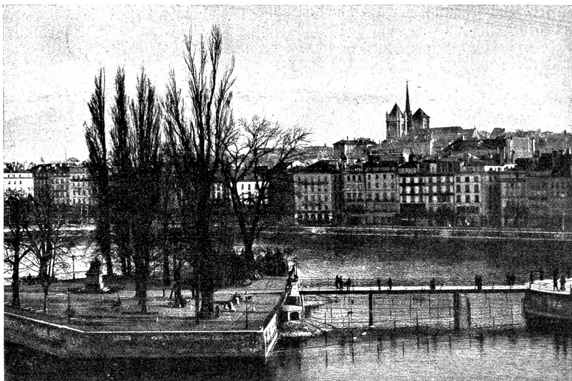
Die Stadt Genf, die zum künftigen Sitz des Völkerbundes erwählt worden ist.

Das noch ganz von imperialistischem Geist erfüllte italienische Volk nahm die Botschaft Wilsons sehr unwillig auf, und die Kammer erteilte den aus Paris zurückgekehrten Staatsmännern ausdrücklich ein Vertrauensvotum. Die Konferenz der Alliierten ließ sich indessen durch diese italienische Extratour nicht beirren, sondern setzte ohne Italien ihre Arbeit fort und lud am 12. Mai auch die österreichischen Delegierten zum Friedensschluß nach St. Germain-en-Laye ein. Dieser Umstand war es hauptsächlich, der dann die Italiener bewog, schleunigst nach Paris zurückzukehren, ohne vorher, wie sie ver-