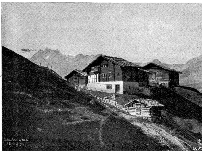
Sündner Oberländer Bauernhaus am Weg von Glanz nach Obersägen.

mausgraues Kleidchen ab und überdeckte es mit einem schimmernden goldenen Mantel. Er hörte die Orgel spielen. Sie tönte so herrlich und gewaltig, wie er es noch gar nie vernommen hatte. Und er selbst war auch in der Kirche; aber es war nur sein leerer Körper, der in der Menge stand — nur sein Körper. Seine Seele war ja aus ihm herausgewachsen und zur Kirche geworden. Das war ein so eigentümliches Gefühl, daß Teddy seine Augen fest schließen mußte, um sich nicht vor sich selbst zu fürchten. Dies alles erlebte er jedesmal, bevor er Seifenblasen zu machen begann. Auf solch wunderliche Weise drückte sich bei ihm die schrankenlose Freude aus. Aber das alles dauerte nur einige kurze Augenblicke, dann fuhr er jäh auf und fing an, seine Zauberfugeln zu fabrizieren. Dabei leuchtete und strahlte sein Gesicht, als wären Sonne und Mond miteinander aufgegangen. Und wenn dann vor seinen staunenden Augen recht viele farbige Kugeln tanzten, dann war er stolz und siegesbewußt, wie ein Künstler, der sein vollendetes Werk beschaut. So auch heute! Als er aber mitten in seinem Glück schwelgte und soeben an der schwierigen Arbeit war, die schönste und größte Kugel seinem Pfeifchen zu entlocken, da überraschten ihn plötzlich die Worte: „Machst du ungeschickte und farblose Kugeln, Teddy!“