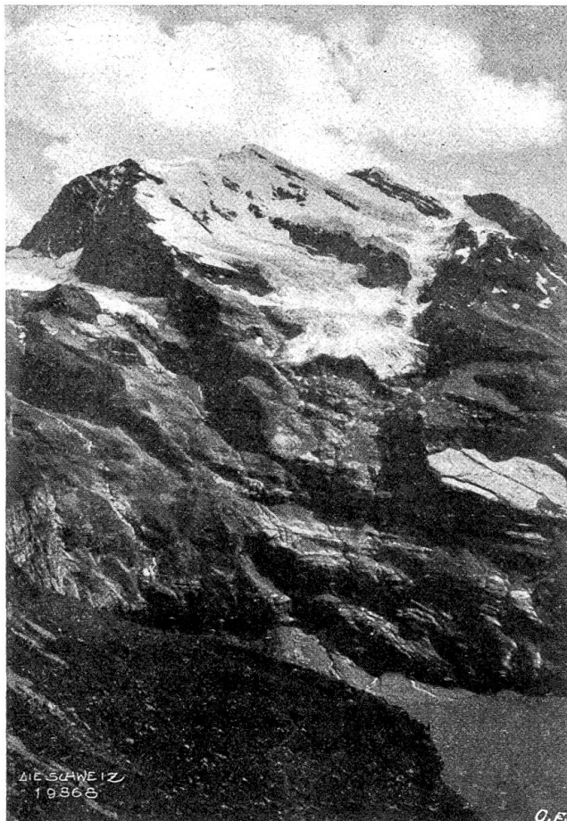
Ferientage im Wallis Abb. 3. Gr. Doldenhorn von der Schinentalp.

schwarzen Walliserbergen und den dahinter aufragenden weißen Hochgipfeln, die noch in der Abendsonne lagen. Und ich wiederholte es, als ich staunend über die ungeheuern Felswände durch Runsen und Spalten hinabstieg und mein Auge immer wieder an den glatten Wänden hinauf- und hinabtaftete und fragte, wie man da hinaufklettern konnte, ehe der Weg gebaut war. Je tiefer man hinuntersteigt, umso höher ragen die Wände, sie scheinen als ungeheure Säulen das Wolkendach zu tragen. Es fielen einige Tropfen. Mit grauen Krallen langte von Norden das Wolkenungewitter über die Berge herüber nach mir, aber ich war ihm entwischt: ich war ja im Wallis, im Land der Sonne, des feurigen Weines und der Erhabenheit! Welch seltenes Land! Während wir in diesem Frühsommer seit fünfzig Tagen uns unter den Regenschirm ducken mußten, hatte es hier im Wallis nur selten geregnet, auf den Straßen lag der weiße Staub wie im heißesten Som-