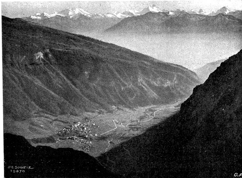
Ferientage im Wallis Abb. 5. Blick von der Bahnhöhe der Gemmi auf Leukerbad und Walliser Alpen (von links nach rechts: Mischabelgruppe, Weisshorn, Dent Blanche).

blicken, bis auch sie sich im blauen Dunst verliert; mitten in der breiten Talsohle steigen spitze Hügel, kleine Berge als kräftig dunkle Silhouetten auf; zu beiden Seiten aber schwingen sich in sanften Linien die Talhänge hinauf bis zu den Grenzen des ewigen Schnees, auf der Südseite von dunkeln Wald bedeckt, durch den die Bäche weiße Runsen geritzt haben, im Norden von unabsehbaren Rebgebirgen, von ungezählten Dörfern und Landhäusern, die auf weit über 1000 Meter Meereshöhe hinaufflettern. Ich glaube, in dieser Erhabenheit aller Verhältnisse liegt der einzige Zauber des Wallis. Ich erinnere mich, wie ich einst am Abend zu Fuß durch das Tal der Bisp hinaufschritt. (Wer geht heute noch zu Fuß von Bisp nach Zermatt?) Auf der gegenüberliegenden Talseite lag hoch, hoch oben im letzten Abendlicht ein Dörfchen, lauter winzig kleine, braunschwarz gebrannte Häuschen, die sich so eng zusammengeschart hatten, wie Schafe beim Herannahen eines Gewitters, bewacht von einem blendendweißen Kirchein, dessen vergoldeter Spitzhelm in der untergehenden Sonne aufblitzte. Mein Weg führte am schattigen Abhang hin;