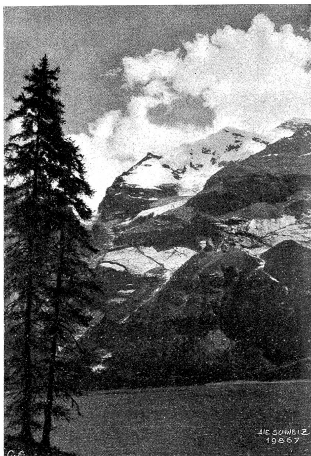
Serientage im Wallis Abb. 2. Deschinensee mit Gr. Doldenhorn.

um eine Ecke des Bergkammes, und durch die Tannenäste blickte ich in schauerliche blaue Tiefe hinunter. Welch ein Anblick! Wer kann hier vorübergehen, ohne erschüttert zu werden, ohne zu erschauern vor solcher Majestät und Erhabenheit? Ich suchte mir ein Plätzchen. Da ragte eine mächtige Föhre wagrecht über den Abgrund hinaus und bot einen Göttersitz ganz in freier Luft. Ach, vor einem guten Duzend Jahre wäre ich ja zweifellos da hinausgefessen und hätte meine Füße fröhlich über dem Dach des Heugadens baumeln lassen, der da etwa 400 Meter senkrecht unter mir lag! Soweit reichte mein Mut jetzt nicht mehr; ich begnügte mich, mich ins hohe Gras und in die Blumen zu setzen. Und da lag denn das Gasterntal (Abb. 4) vor meinen Blicken, dieses wildeste aller Alpentäler, aus dem rings die Bergwände in erschreckender Steilheit sich aufschwingen, in immer neuen Anfängen, mit immer rück-