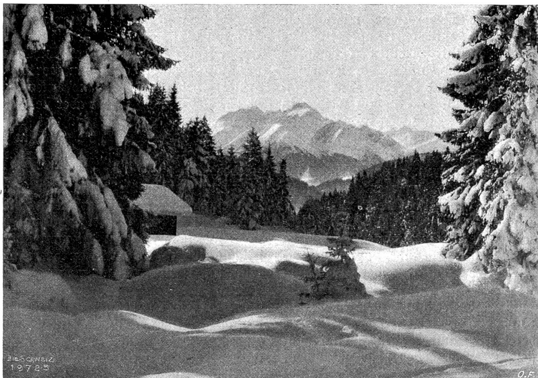
Bei Staderas (Weg nach Laax); im Hintergrund Bis Aul.