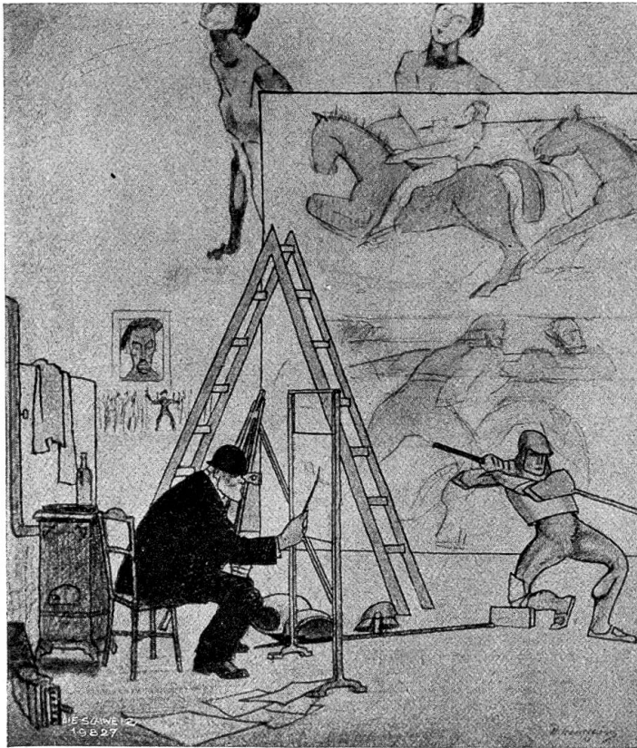
Ferdinand Hodler in seinem Atelier, am zweiten Wandgemälde für den Waffensaal des Schweiz. Landesmuseums.

kein besonderes Verständnis entgegenbringen. Der Wert des Bildes ist seither ins Zwanzigfache gestiegen. Hodler hatte damals ein ungemein bescheidenes Atelier in der Altstadt Genf, droben beim Stadthaus, wenn man nämlich die Dachbude im sechsten oder siebenten Stock des Hauses Nr. 35 der Grand'rue als ein Atelier bezeichnen darf. Was diese Dachkammer auszeichnete, war eine prächtige Aussicht auf den See und die umliegenden Ufer, sonst aber bestand sie aus einem kleinen Raum, in den Mauerpalten die nötige Ventilation brachten und wo auf Brettergestellen und am Boden die ungerahmten Arbeiten herumlagen, die heute Prunkstücke unserer größten Museen bilden. Die Pinsel waren in einer zerbrochenen Venusstatue auf dem sog. Schreibtische des Künstlers vereinigt, die Bibliothek bestand aus einigen vergilbten Bändchen und Gottfried Kellers Werken. Das letztere ist wesentlich.