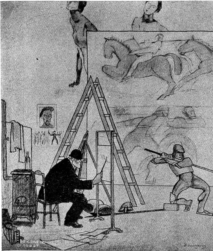
Ferdinand Hodler in seinem Atelier, am zweiten Wandgemälde für den Waffensaal des Schweiz. Landesmuseums.

kein besonderes Verständnis entgegenbringen. Der Wert des Bildes ist seither ins Zwanzigfache gestiegen. Hodler hatte damals ein ungemein bescheidenes Atelier in der Altstadt Genf, droben beim Stadthaus, wenn man nämlich die Dachbude im sechsten oder siebenten Stock des Hauses Nr. 35 der Grand'rue als ein Atelier bezeichnen darf. Was diese Dachkammer auszeichnete, war eine prächtige Aussicht auf den See und die umliegenden Ufer, sonst aber bestand sie aus einem kleinen Raum, in den Mauerpalten die nötige Ventilation brachten und wo auf Brettergestellen und am Boden die ungerahmten Arbeiten herumlagen, die heute Prunkstücke unserer größten Museen bilden. Die Pinsel waren in einer zerbrochenen Venusstatue auf dem sog. Schreibtische des Künstlers vereinigt, die Bibliothek bestand aus einigen vergilbten Bändchen und Gottfried Kellers Werken. Das letztere ist wesentlich.