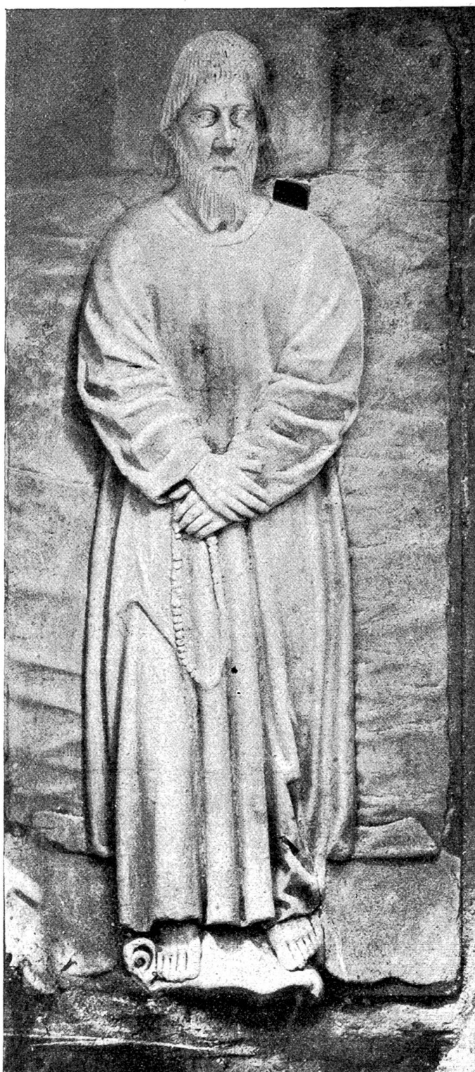
Deckplatte von Bruder Klausens Grabmal (1518) in der Kirche zu Sachseln.

Im alten Zürichkrieg wurde nun bekanntlich diese doppelte Not in eine und die nämliche Krisis verwickelt. Vorerst war es reiner Bruderzank. Bruderklaus focht mit, aber nicht begeistert. Sein Kamerad malt ihn im Sachslers Kirchenbuch ein Jahr