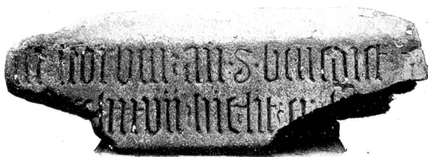
Bruchstück der alten Inschrift am Bruderklausen-Grabmal (von 1518) im Museum zu Sarnen; erhaltene Schrift: „... ist storben an s. benedict ... LXXXVII, hie lit er b(e)graben“.

Wir wissen, wie Pius II. durch den Streit des Kardinals Nikolaus Cusa von Brixen mit Sigismund III. in amtliche und persönliche Mitleidenschaft gegen den Habsburger gerissen wurde, den Gegner bannte und die Eidgenossen rüstig zum Angriff auf den Erzherzog ermunterte. Vor kaum neun Monaten hatte derselbe Papst unter Androhung geistlicher Strafen die gleichen Eidgenossen und den nämlichen Sigismund in ähnlichen Streitsachen, in denen er sie jetzt untereinander wieder in den Haaren wünschte, sich in die Arme zu führen versucht. Dem Herzog konnte allerdings niemand recht trauen, weder der Eidgenosse noch der Papst, und Sigismund verbesserte durch sein stetes launen-