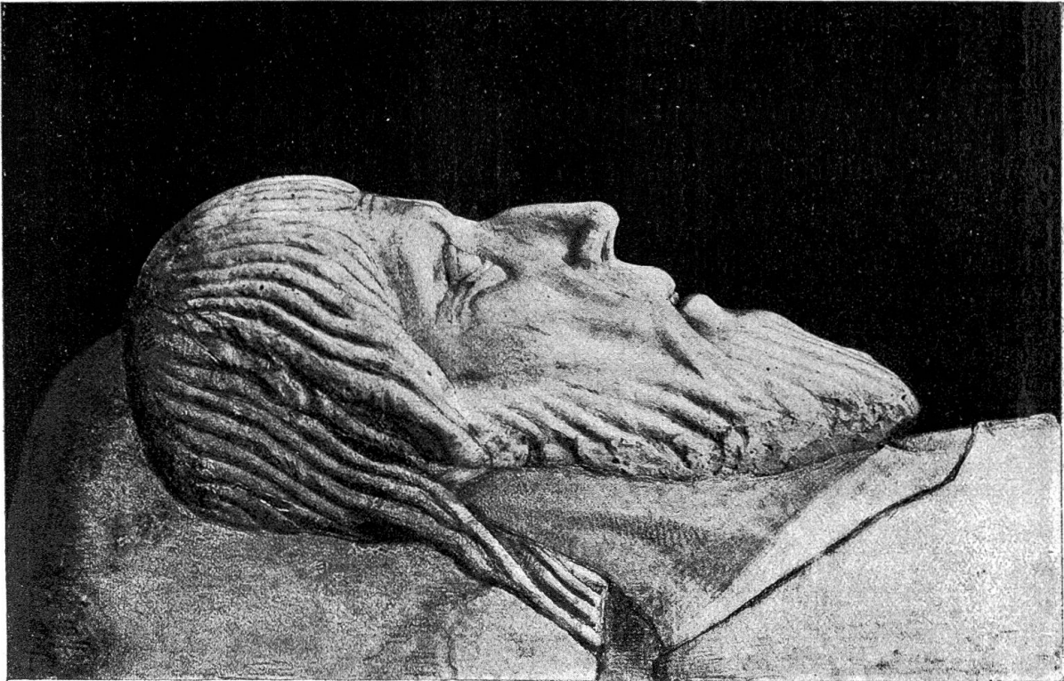
Bildnis Kopf vom Bruderklausen-Grab (1518).

nach dem Tode als einen, der „in kriegten sin vnyend wenig beschediget, sunders nach siner vermögent beschirmt“. Es war eben doch eine saure Geschichte, gegen den Genossen zu fechten. Als die Schwyzer bereits über die March ins Zürcherische vordrangen, waren es darum neben Urnern vor allem Bruderklausens Unterwaldner, die Boten mit den schwersten Abmahnungen vor einem Bürgerkrieg den Ehel hinaus schickten. Schon vorher hatte man in Beckenried, wieder in Bruderklausens Nähe, einen Aufschub erbracht.