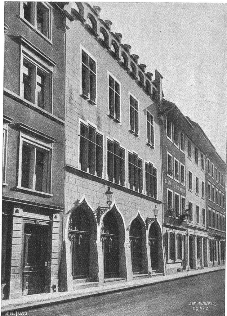
Die alte „Kunsthalle“ in Winterthur.

Ein besonderes Wort endlich verdient auch die Illustration dieses zweiten Bandes, die derselbe kluge Sinn gewählt hat, der über dem ersten Buche waltete. Es sind alles Bilder von dokumentarischem Wert, Porträte, die den Text ergänzen,